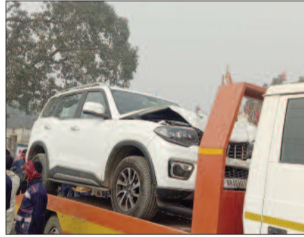
क्षतिग्रस्त वाहन को ले जाते लोग