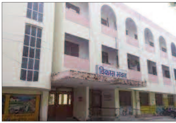
550 लाभार्थी विधवा पेंशन में भी बढ़ीं : जिले में विधवा पेंशन

लाभार्थियों का आधार प्रमाणीकरण हो चुका है। अब बुजुर्गों के खाते में तीन माह पर तीन हजार रुपये भेजे जा रहे हैं। इससे लाभार्थियों को बड़ी राहत मिली है। पहले मासिक पेंशन की राशि 500 रुपये थी।