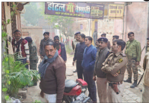
होटल को सील करते कर्मचारी व मौजूद अधिकारी व पुलिस

हुए 19 युवक, 22 युवतियों और दो महिला दलाल को होटल के कमरों से गिरफ्तार किया था। गिरफ्तारी के बाद पुलिस ने होटल के रजिस्टर की जांच किया तो रजिस्टर में केवल युवक का नाम पता अंकित था। किसी के साथ