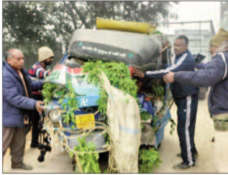
सब्जी लंदे क्षतिग्रस्त आटो को ले जाती पुलिस