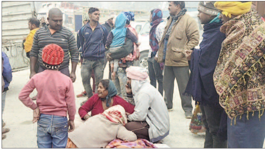
घटना के बाद रोते बिलखते मृतक के परिजन

लेवाड़ के पास अल सुबह आपस में टकरा गई थी चार वाहन : मिली जानकारी के अनुसार कृष्णाब्रह्म व नया भोजपुर ओपी थाना क्षेत्र के बाईर पर स्थित लेवाड़ के पास अल सुबह करीब 2 बजे एक साथ चार वाहन आपस में टकरा गए। जिसमें कार स्कार्पियो से टकराने के बाद सड़क निर्माण कंपनी द्वारा लगाए गए बैरियर से भी टकरा