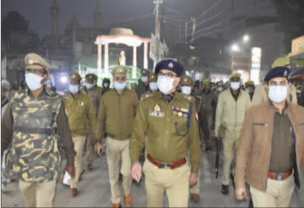
रूट मार्च में शामिल एसपी व अन्य पुलिस अधिकारी

बल का प्रबंध किया गया है। एसपी ने निर्देश दिया है कि जनपद के प्रत्येक क्षेत्र में पुलिसकर्मी मौजूद रहेंगे। पैदल गश्त के अलावा पीआरबी, थाना सेकेंड मोबाइल निरंतर गश्त करेंगे। मोटर साइकिल व वाहन पर भी पुलिसकर्मी अराजक तत्वों/शौहदाँ की गतिविधियों की देखरेख के लिए लगाए गए हैं। सभी क्षेत्राधिकारी/थाना प्रभारी/थानाध्यक्ष/चौकी प्रभारी निरंतर भ्रमणशील रहकर नव वर्ष को सफुलल समान कराएंगे। इसके अतिरिक्त जनपद में जनता में सुरक्षा की भावना बनाए रखने एवं अभिसूचना संकलन के उद्देश्य से दिनांक 31/12/2022 की शाम आगामी नव वर्ष के दृष्टिगत थाना गाजीपुर कोतवाली नगर क्षेत्र में मय फोर्स रूट मार्च/पैदल गश्त किया गया। आम जनमानस में शांति एवं सुरक्षा की भावना का संचार किया गया। रूट मार्च के दौरान आम जनमानस से बातचीत भी किया गया।