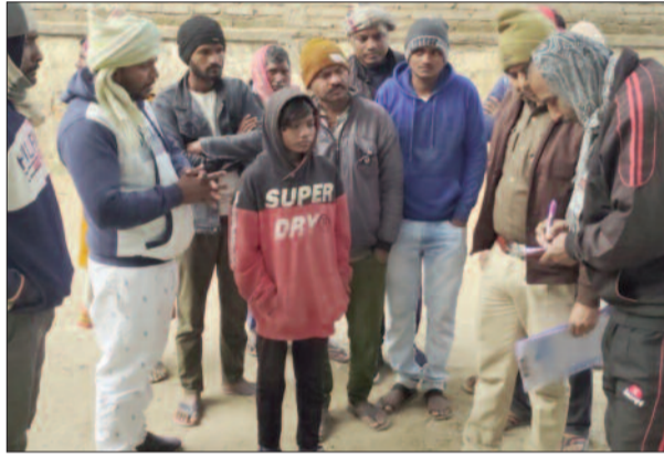
घटना की जानकारी लेते पुलिस कर्मी व मौजूद ग्रामीण

जिले नवादा थाना क्षेत्र के बहिरो में शुक्रवार की रात एक युवक की लाठी-डंडे से पीट-पीट कर हत्या कर दी गयी। उसका शव शनिवार की सुबह शव बहिरो लख नंबर 11 छठिया नहर के पास ओवरब्रिज के पीछे से बरामद किया गया। उसके शरीर पर कई जगह जखम के निशान मिले हैं। उसके कारण लाठी-डंडों से पीटकर हत्या करने का अंदेश लगाया