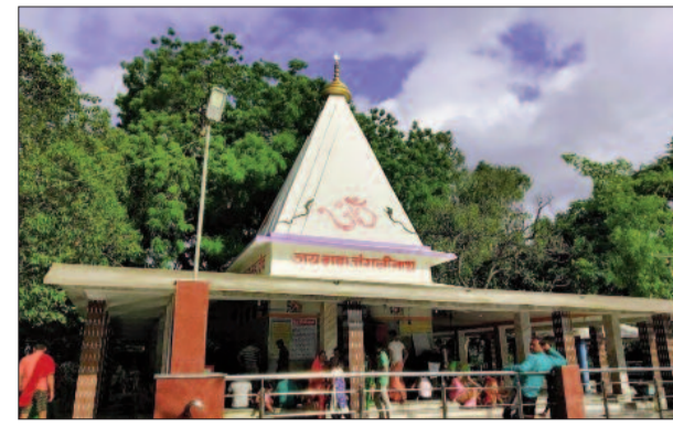
डुमराव स्थित जंगलीनाथ बाबा का मंदीर

हैं, वहीं बहुत से ऐसे भी ग्राहक आते हैं जो फूल और माला लेकर देवी देवताओं को अर्पित कर अपने मंगल भविष्य की कामना करते हैं। पिकनिक स्पॉट भी सजे, पूरे दिन