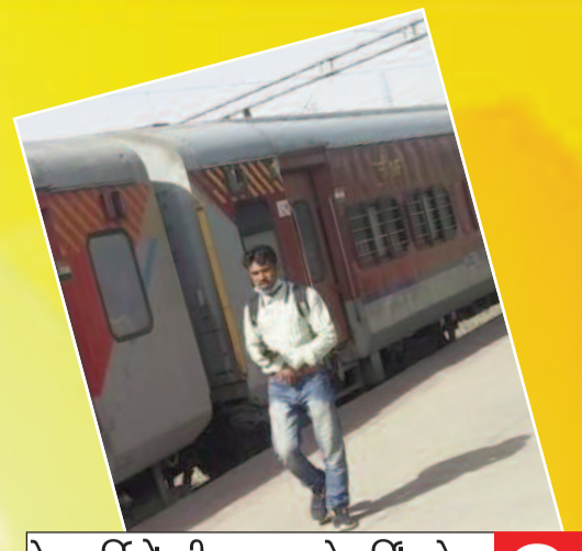
रेलकर्मियों की तपस्वता से बर्निंग ट्रेन होने से बची पटना-इंदौर एक्सप्रेस 3

प्रमुख खबरें : पटना ■ भोजपुर ■ बक्सर ■ रोहतास ■ पूर्वांचल ■ मिथिलांचल ■ विविध ■ खेल ■ आर्थिक