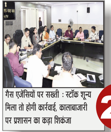
गैस एजेंसियों पर सख्ती : स्टॉक शून्य मिला तो होगी कार्रवाई, कालाबाजारी पर प्रशासन का कड़ा शिकंजा