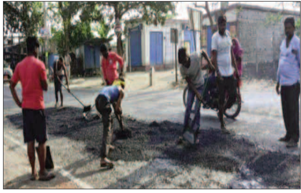
करवा रहा है। मुख्यमंत्री नीतीश वैशाली महोत्सव में शामिल होने आ कुमार एक दशक बाद तीन दिवसीय रहे हैं। जिला मुख्यालय हाजीपुर से

एजेंसी। पटना वैशाली महोत्सव में मुख्यमंत्री नीतीश कुमार के आगमन से पहले वर्षों से जर्जर सड़कों की आनन-फानन में मरम्मत शुरू कर दी गई है। प्रशासन के दबाव में तेजी से काम तो हो रहा है, लेकिन गुणवत्ता को लेकर स्थानीय लोग सवाल उठा रहे हैं। बिहार के मुख्यमंत्री नीतीश कुमार वैशाली महोत्सव के उद्घाटन समारोह में शामिल होने के लिए आज शाम को वैशाली पहुंच रहे हैं। उनके आगमन से पहले जिला प्रशासन बुद्धर पर सड़कों की मरम्मत