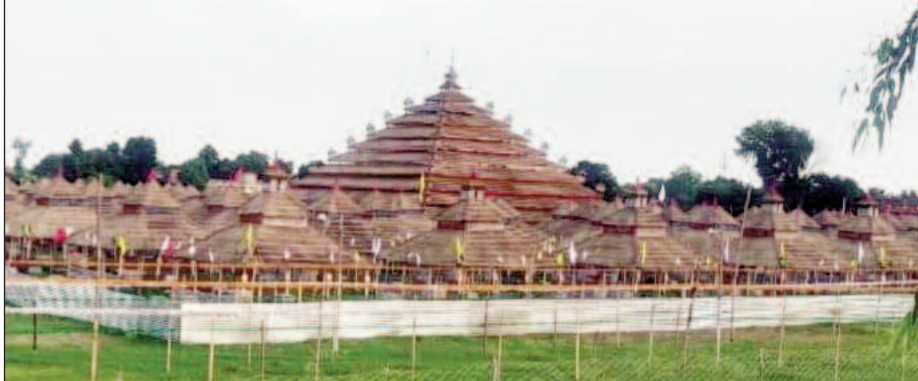
यज्ञ स्थल पर बना विशाल मंडप।