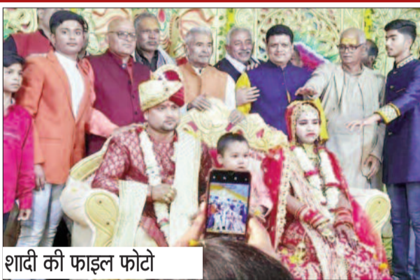
शादी की फाइनल फोटो

जिले के मुफरसिल थाना क्षेत्र के कमरपुर गांव में 24 सितंबर को एक विवाहिता ने पति की बेवफाई से आंजल आ खुद को आग के हवाले कर दिया था। इस घटना में वह बुरी तरह से झुलस गई थी। ससुराल वालों ने उस पर रहम दिखाते हुए उसके शरीर में लगे आग को बुझा जरूर दिए थे। लेकिन इसके बाद उनकी मानवता तथा संवेदनाएं मर गई थी। आग से झुलसने के बाद पीड़िता तड़प रही थी तथा पानी मांग रही थी। लेकिन एक ग्रामीण चिकित्सक के सामने उसके ससुराल वाले पानी व दवा देने के बदले मोबाइल से वीडियो