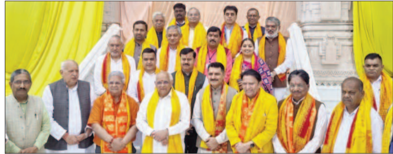
अयोध्या में बनेगा यात्री निवास

सर्वाधिक लोकप्रिय नेता और भारत के प्रधानमंत्री नरेंद्र मोदी व मुख्यमंत्री योगी आदित्यनाथ के नेतृत्व में अयोध्या मंदिर में प्रभु श्रीराम चंद्र जी का औलौकिक प्राण प्रतिष्ठा देश में नए काल चक्र का उदोष है। इतना ही नहीं अगले एक हजार वर्ष के लिए रामराज्य की स्थापना का यह संकल्प भी है। राम मंदिर भारत की इतिहास का मंदिर बन गया है। सही अर्थों में यह मंदिर राष्ट्र के चेतना और नव जागरण का मंदिर बना है। श्री रामलला के प्राण प्रतिष्ठा का समारोह राष्ट्र उत्सव के रूप में मनाया गया, जो एक नए युग की शुरुआत है। हर एक हिंदू का संकल्प था कि अयोध्या में राम मंदिर का भव्य निर्माण होना चाहिए। आज यह पूर्ण हो गया है।