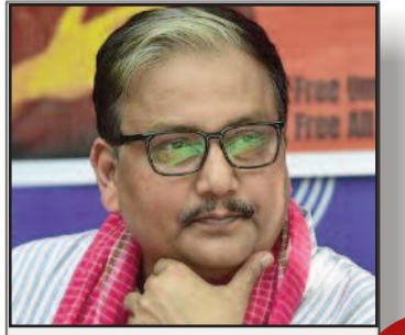
तेजस्वी को मिले अपार जन समर्थन से घबराहट में है भाजपा