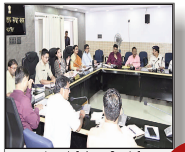
बक्सर में रसोई गैस की कोई कमी नहीं, अफवाहों से बचें : डीएम साहिवा

प्रमुख खबरें : दिल्ली ■ पटना ■ बक्सर ■ शाहाबाद ■ मगध