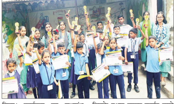
मिला। कार्यक्रम का शुभारंभ औपचारिक रूप से किया गया, जिसके पश्चात उत्कृष्ट प्रदर्शन करने वाले विद्यार्थियों को मंच पर आमंत्रित

केटी न्यूज/रोहतास बुधवार मॉडर्न किड्स प्ले स्कूल ए.एस कॉलेज रोड बिक्रमगंज में वार्षिक परीक्षा परिणाम गरिमामय कार्यक्रम साथ घोषित किया गया। परिणाम घोषणा समारोह विद्यालय परिसर में उत्सव जैसा प्रतीत हो रहा था। विद्यार्थियों के चेहरों पर आत्मविश्वास, अभिभावकों के मन में गर्व और शिक्षकों की आंखों में संतोष स्पष्ट झलक रहा था। पूरे विद्यालय में सकारात्मक ऊर्जा और उपलब्धि का उल्लास देखने को