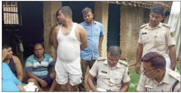
घटना को लेकर परिजनों से पूछताछ करते पुलिस अधिकारी।

◆ बोले एस्प्री... परिजनों व ग्रामीणों से हुई है पूछताछ, दर्ज की गई है प्राथमिकी ◆ परिजनों ने पुलिस को दिए हैं नाम और नंबर