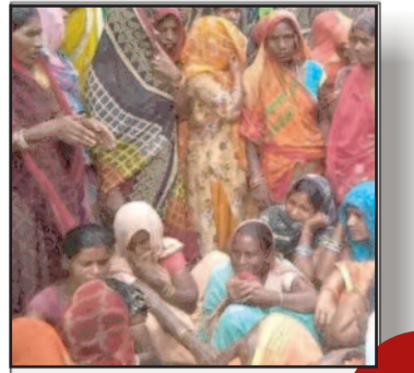
दरभंगा में अनियंत्रित वाहन ने सात युवकों को रोड़ा, दो की मौत