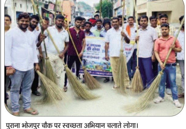
पुराना भोजपुर चौक पर स्वच्छता अभियान चलाते लोग।