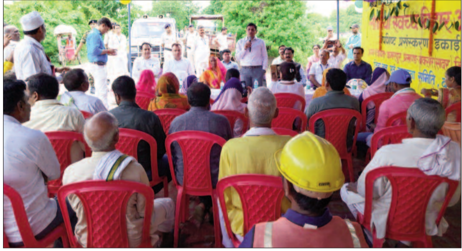
गांधी जयंती के अवसर पर सदर प्रखंड के कमरपुर में लोगों को स्वच्छता की जानकारी देते बक्सर डीएम व अन्य।