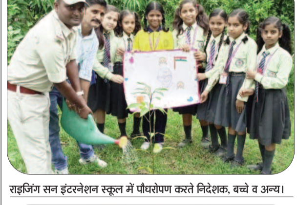
सईजिंग सन इंटरनेशन स्कूल में पौधरोपण करते निदेशक, बच्चे व अन्य।