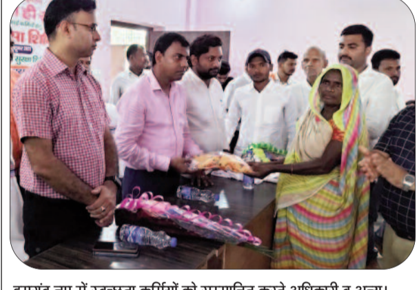
हुमरांव नग में स्वच्छता कर्मियों को सम्मानित करते अधिकारी व अन्य।