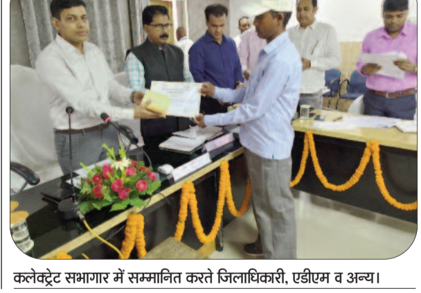
कलेक्ट्रेट सभागार में सम्मानित करते जिलाधिकारी, एडीएम व अन्य।