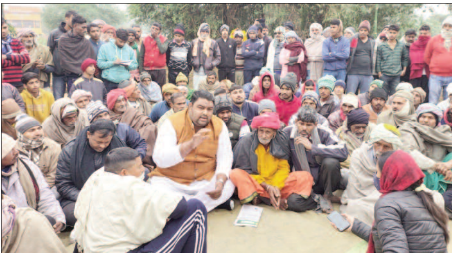
बैठक में उपस्थित नेता, अधिकारी, कर्मचारी व ग्रामीण

लेकिन स्थानीय नवाडेर व पुराना भोजपुर के ग्रामीणों ने इसका विरोध शुरू कर दिया है। ग्रामीणों का तर्क है कि यह तालाब 200 वर्ष पुराना है तथा इसके किनारे लोक आस्था के महापर्व छठ के साथ ही श्राद्ध कर्म सहित कई अन्य धार्मिक अनुष्ठान किए जाते हैं। जबकि गर्मी के मौसम