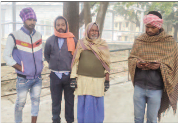
अस्पताल में जुटे परिजन