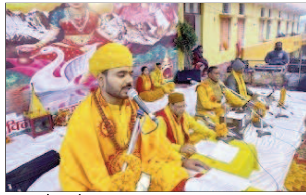
प्रवचन करते आचार्य

काशी में दशाश्वमेध यज्ञ किया था, वहीं महाभारत युद्ध के पश्चात युधिष्ठिर ने राजसूय यज्ञ किया था ताकि वातावरण को साकारात्मक बनाया जा सके। सभी मनुष्यों को प्रतिदिन यज्ञ करना चाहिए। बताया कि