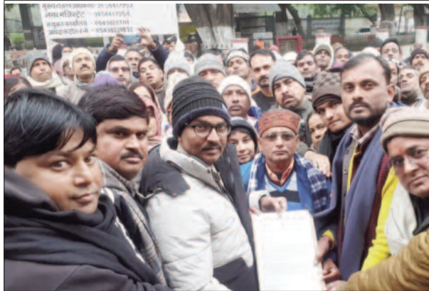
नारेबाजी करते शिक्षामित्र

सोमवार को उत्तर प्रदेश प्राथमिक शिक्षा मित्र संघ के प्रांतीय नेतृत्व के निर्देश पर जिले के शिक्षामित्रों ने अपनी समस्याओं को लेकर कलेक्ट्रेट परिसर में प्रदर्शन किया। कलेक्ट्रेट तक शिक्षा मित्रों ने पैदल मार्च किया और जमकार सरकार के जिम्मेदारियां बढ़ गयी हैं। बच्चे उच्च शिक्षा ग्रहण कर रहे हैं। किसी किसी के बेटे-बेटियां विवाह के योग्य हो गई हैं। वर्तमान समय में शिक्षामित्रों को प्रतिमाह मात्र 10 हजार मानदेय, वह भी केवल 11 माह का मिलता है। यह मेहनताना इस मंहगाई के दौर