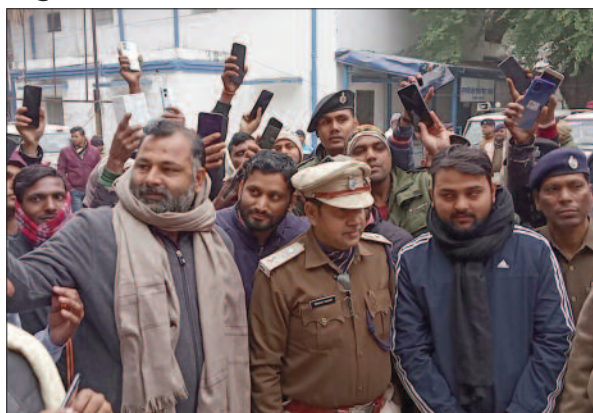
मोबाइल धारक के साथ एसपी