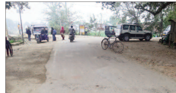
केसठ स्थित बस स्टैंड में पसरा सन्नाटा है, जिसके चलते राहगीरों को ठंड से राहत मिलती नजर नहीं आ रही है।

जनवरी माह का प्रारंभ होते ही तापमान में लगातार गिरावट हो रही है। लगातार टंड का प्रकोप बढ़ता जा रहा है। कड़ाके की ठंड से लोग बेहाल हैं। सर्द हवाओं और कोहरे के चलते जनजीवन प्रभावित हुआ है। लोगों को अपने कामों में भारी मुश्किलों का सामना करना पड़ रहा है। वहीं कोहरे के कारण सूर्य भी नहीं दिखाई दे रहे हैं, जिसके चलते तापमान में लगातार गिरावट आ रही है। कड़ाके की ठंड से बचने के लिए लोग तरह-तरह के उपाय कर रहे हैं। सर्द हवाओं के चलते टंड में लगातार इजाफा हो रहा है बढ़ती ठंड से लोगों की मुश्किलें भी बढ़ रही हैं। लगातार बढ़ती ठंड के बावजूद भी प्रशासन की ओर से अभी तक अलाव की व्यवस्था नहीं की गई