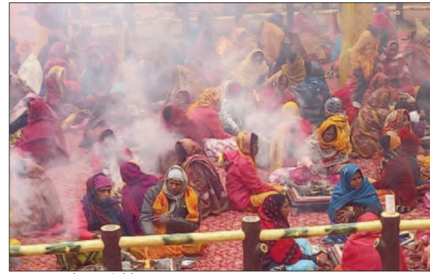
हवन कुण्ड में आहुती देते भक्त

द्वारा अपना इच्छित मनोकामनाओं को प्राप्त कर सकते हैं। महाराज दशरथ को