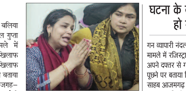
घटना के बाद रोती व्यवसायी की पत्नी।