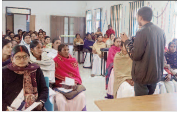
प्रशिक्षण के दौरान जानकारी देते स्वास्थ्य अधिकारी।

अनुमंडल के सभी प्रखंडों में 10 फरवरी से सर्वजन दवा सेवन यानि मास ड्रग एडमिनिस्ट्रेशन अभियान चलाया जायेगा। यह अभियान 14 दिनों तक चलेगा। स्वास्थ्य विभाग इस अभियान की तैयारी में जुटा है।