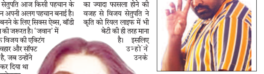
साथ ऑनस्क्रीन रोमांस करने से साफ इनकार कर दिया था। इसके बाद फिल्म में शरति हासन को कास्ट किया गया था।

साउथ सिनेमा के स्टार एक्टर विजय सेतुपति आज किसी पहचान के मोहताज नहीं हैं। उन्होंने इंडस्ट्री में बतौर विलेन अपनी अलग पहचान बनाई है। उन्होंने ये साबित किया है कि एक अभिनेता बनने के लिए सिक्स पैक्स, बांडी और गुड लुकिंग की जरूरत नहीं बल्कि स्किल की जरूरत है। 'जवान' में काली गायकवाड़ से सभी का दिल जीत चुके विजय की एक्टिंग की जितनी चर्चा होती है। उतनी ही उनके व्यवहार और सॉफ्ट हार्ट की भी होती है। उनसे जुड़ा एक किस्सा है, जब उन्होंने एक एक्ट्रेस के साथ काम करने से इनकार कर दिया था और इसके पीछे की वजह थी बाप-बेटी का कनेक्शन, जो खून से तो नहीं था मगर दिल से रिश्ता बना था। दरअसल, 'जवान' की सफलता के बाद विजय सेतुपति का एक पुराना इंटरव्यू चर्चा में आया था, जिसमें उन्होंने साउथ की ब्यूटीफुल और पॉपुलर एक्ट्रेस कृति शेट्टी के साथ काम करने से मना कर दिया था। इसके पीछे की वजह उन्होंने बाप-बेटी का रिश्ता बताया था। ये बात उन दिनों की है जब कृति ने अपने करियर की शुरुआत की थी। उनकी पहली फिल्म 'उपेना' थी। ये यूवी हिट रही थी।