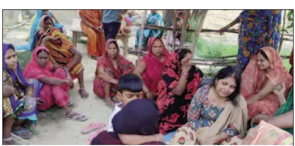
गांव में फैली सनसनी