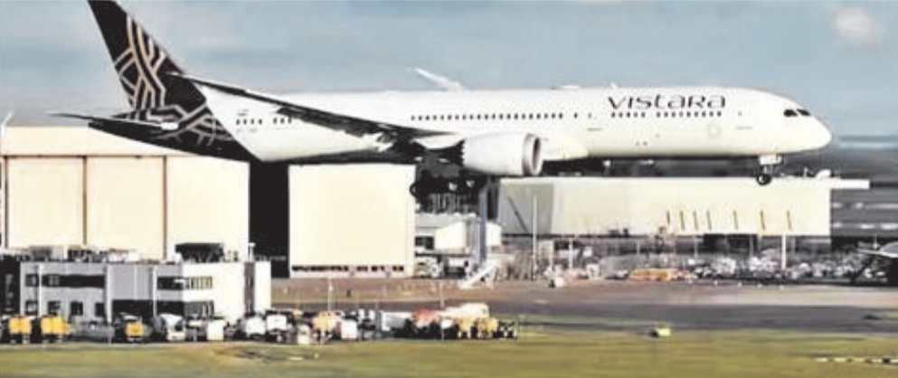
की गौरवशाली विरासतों और सर्वोत्तम प्रथाओं का लाभ उठाने के लिए तय है, क्योंकि हम एक नया एयरलाइन समूह बना रहे हैं, जिस पर भारत को गर्व हो सकता है। इसका मतलब है कि विस्तारा की वर्तमान फ्लाइट

एयर इंडिया के प्रवक्ता ने कहा, हम दोनों एयरलाइनों