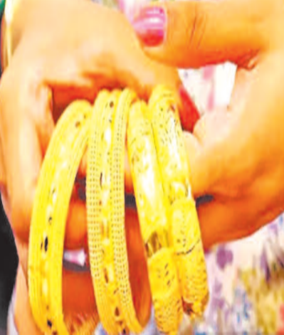
दौरान यह ग्रोथ 10 प्रतिशत थी। इस क्षेत्र में बैंकों में कड़ी प्रतिस्पर्धा के बावजूद यह ग्रोथ देखने को मिली है। आरबीआई के सेक्टरल डेटा के मुताबिक अगस्त 2024 में गोल्ड लोन पिछले साल के मुकाबले लगभग 41 प्रतिशत बढ़कर

नई दिल्ली, एजेंसी। बैंकों और नॉन-बैंकिंग फाइनेंस कंपनियों के गोल्ड लोन में रिकॉर्ड ग्रोथ देखने को मिली है। लेकिन इसने आरबीआई की चिंता बढ़ा दी है। केंद्रीय बैंक ने बैंकों से कहा है कि वे लोन की अकाउंटिंग से जुड़ी खामियों को दूर करें ताकि बैंड लोन की समस्या से बचा जा सके। फाइनेंस इंडस्ट्री डेवलपमेंट काउंसिल के आंकड़ों के मुताबिक वित्त वर्ष 2025 की पहली तिमाही में गोल्ड लोन में पिछले साल के मुकाबले 26 प्रतिशत और मार्च तिमाही की तुलना में 32 प्रतिशत की वृद्धि हुई है। इस दौरान कुल स्वीकृत राशि 79,217 करोड़ रुपये के बराबर है। यह ग्रोथ केवल इस बार ही नहीं हुई है, बल्कि कई तिमाहियों से लगातार हो रही है।