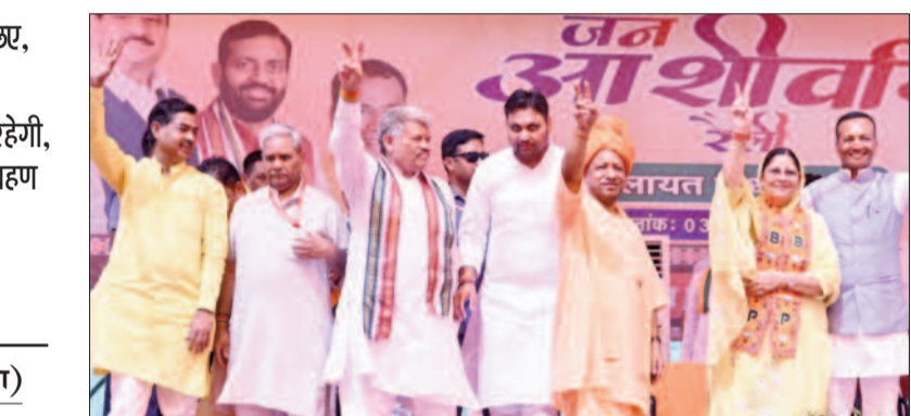
कांग्रेस का हाथ, माफिया के साथ : योगी आदित्यनाथ

उत्तर प्रदेश के मुख्यमंत्री योगीने कहा कि लोकसभा चुनाव में कांग्रेस ने झूठ फैलाया था कि फिर से भाजपा सरकार बनी तो संविधान व आरक्षण समाप्त कर देगी। उन्होंने यह भी कहा था कि हर गरीब को एक लाख रुपये देंगे। कांग्रेस से पूछिए कि उनका खटाखट-खटाखट कहां है। खटाखट-खटाखट कहने वाले राहुल गांधी मैदान छोड़कर सफाचंद हो चुके हैं। कांग्रेस ने खटाखट के जरिए केवल झूठे वायदे किए, क्योंकि इन्होंने देश को सफाचंद किया था। समाज को जाति, क्षेत्र, भाषा, मत-मजहब के नाम पर बांटना कांग्रेस के डीएनए का पार्ट है, जिससे देश को कमजोर किया जा सके। देश कमजोर होगा तो सनातन कमजोर होगा। सनातन कमजोर होगा तो वर्तमान असुरक्षित और भावी