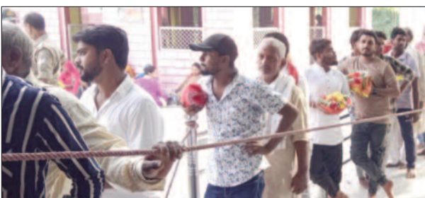
कलिकापुराण में है वर्णन

जिले में वैदिक काल से ऋषियों-मुनियों एवं साधकों की भूमि रही है। जहां पर महर्षि जमदग्नि, परशुराम एवं विश्वामित्र प्र ऋषियों ने अपने त्याग और तपस्या से इस जनपद को देवभूमि बना दिया था, जहां इस भूमि पर भगवान परशुराम का बचपन बीता था। उधर भगवान राम ने अपने अनुज सहित राक्षसों का संहार करना आरंभ किया था। गहमर स्थित मां कामाख्या धाम। कामाख्या शब्द की व्याख्या इस प्रकार की गई है, जो भक्तों की कामना को पूर्ण करती हैं अथवा भक्त साधकों द्वारा जिसकी कामना की जाती है, वह कामा है। जिसका नाम ही कामाख्या है।