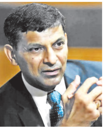
आर्थिक सलाहकार वी. अनंत नागेश्वरन ने नीतिगत दर निर्धारण की प्रक्रिया से खाद्य महंगाई को बाहर रखने की कवालत की थी। उन्होंने कहा था कि मौद्रिक नीति का खाद्य वस्तुओं की कीमतों पर कोई लेना-देना नहीं होता है। पूर्व आरबीआई गवर्नर ने कहा, ऐसे में जब आरबीआई कहता है कि महंगाई कम है तो पीपीआई पर नजर डालें। अगर उपभोक्ता कुछ अलग तरह की चुनौतियों का सामना कर रहे हैं तो वे वास्तव में यह नहीं मानते कि महंगाई कम हुई है।

नई दिल्ली, एजेंसी। भारतीय रिजर्व बैंक (आरबीआई) के पूर्व गवर्नर रघुराम राजन ने कहा कि वह खाद्य मूल्य वृद्धि को मुख्य मुद्रास्फीति से बाहर रखने से सहमत नहीं हैं। उनका कहना है कि ऐसा करने से लोगों का केन्द्रीय बैंक के प्रति भरोसा कमजोर होगा, क्योंकि इसे महंगाई को नियंत्रित करने की जिम्मेदारी दी गई है। राजन ने कहा कि मुद्रास्फीति (महंगाई) को उन वस्तुओं और सेवाओं पर केंद्रित चाहिए, जो लोग रोजमर्रा के जीवन में उपयोग करते हैं। उपभोक्ताओं की धारणा महंगाई के आंकड़ों पर निर्भर करती है।