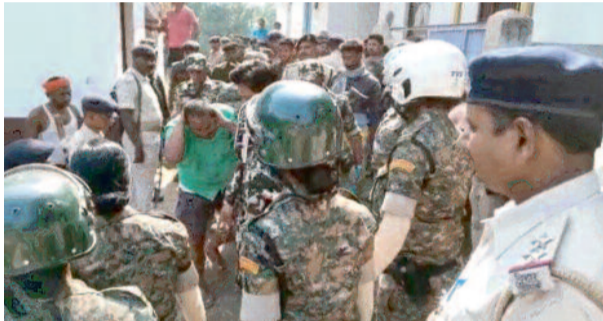
हंगामे के बाद पहुंची पुलिस फोर्स