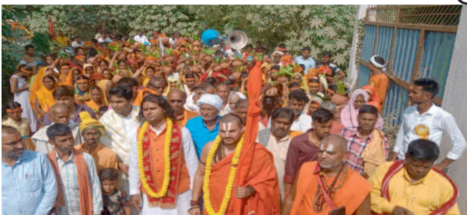
फोटो : कलाश यात्रा में शामिल श्रद्धालु