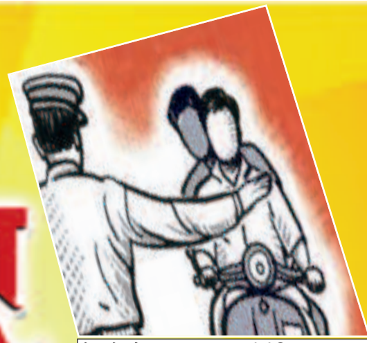
चौक-चौराहों पर चला सखन रूप से चेकिंग अभियान, वसूला गया जुमाना

प्रमुख खबरें : पटना ■ भोजपुर ■ बक्सर ■ रोहतास ■ पूर्वांचल ■ विविध ■ खेल ■ आर्थिक