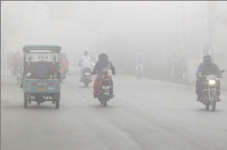
घने कोहरे के बीच सड़क पर वाहनों से जाते लोग

शीतलहर से लोग कांपते रहे और बहुत जरूरी होने पर घरों से निकले। मंगलवार को अधिकतम व न्यूनतम तापमान एक डिग्री लुढ़क गया। अधिकतम जहां 19 डिग्री वहीं न्यूनतम छह डिग्री तक पहुंच गया और हवा की रफ्तार भी अधिक रही। 9.4 किमी की गति से चल रही पछुआ हवा के कारण मंगलवार को गलन बरि ठंड में और इजाफा हो गया। कड़ाके की ठंड पड़ने से लोगों के कामकाज भी प्रभावित होने लगे हैं। शहर से