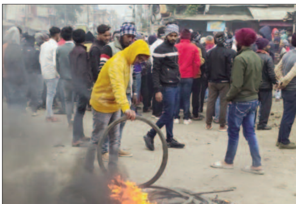
टायर जला कर सड़क जाम करते गुस्साए युवा