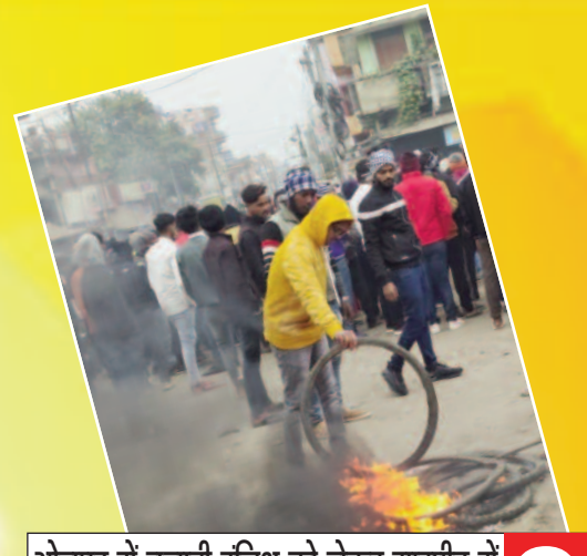
भोजपुर में चुनावी रजिस्ट्रार को लेकर मारपीट में स्नातक के छात्र की मौत, हंगामा व रोड़ जाम

प्रमुख खबरें : पटना ■ भोजपुर ■ बक्सर ■ रोहतास ■ पूर्वांचल ■ मिथिलांचल ■ विविध ■ खेल ■ आर्थिक