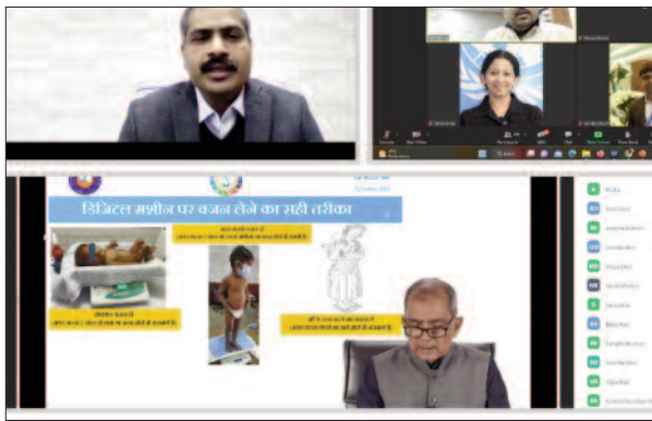
वरुअल उन्मुखीकरण कार्यक्रम में शामिल राज्यस्तरीय अधिकारी

के पहले सप्ताह में शून्य से छह साल तक के बच्चों की वृद्धि निगरानी की जाएगी। इसे फरवरी माह से शुरू किया जाएगा, जिसे वजन सप्ताह या वृद्धि निगरानी सप्ताह के रूप में मनाया जाएगा। कार्यक्रम का उद्देश्य बच्चों की वृद्धि की बेहतर निगरानी करने की है। योजना के छह मुख्य घटकों में वृद्धि निगरानी एक महत्वपूर्ण घटक है। बच्चों के लिए 6 साल तक का समय