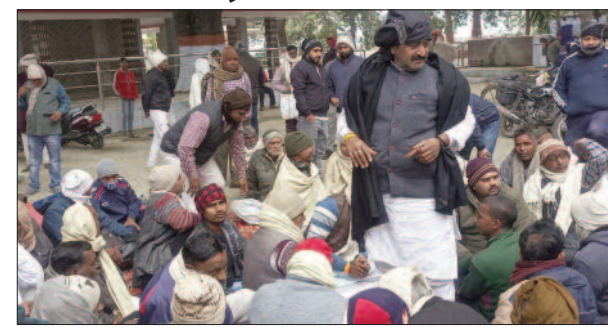
बैठक में उपस्थित डीलर

केन्द्र सरकार द्वारा जनवरी महीने से फ्री में खाद्यान्न देने की घोषणा के बाद से ही जन वितरण प्रणाली के दुकानदार उग्र हो गए हैं। डीलरों ने अब सरकार के खिलाफ संघर्ष तेज करने का निर्णय लिया है।