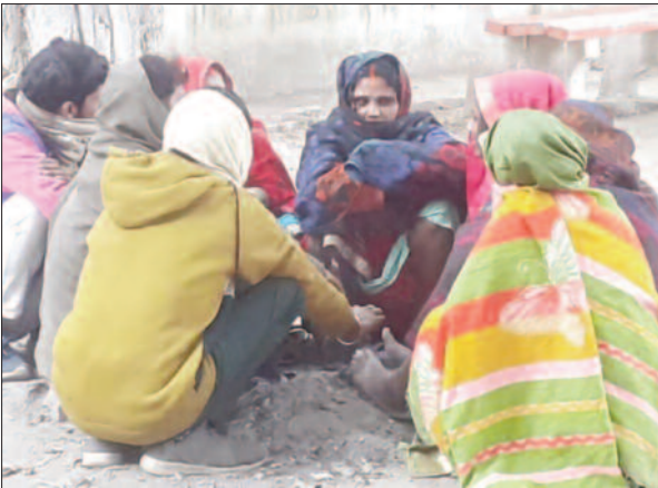
ठंड से बचने के लिए आग का सहारा लेते लोग

गांव तक लोग ठंड से बेहाल हैं और अलाव की व्यवस्था नहीं होने से लोगों को परेशानी का सामना करना पड़ रहा है। शहर के रेलवे स्टेशन, रोडवेज बस स्टॉप पर ठंड से पूरे दिन लोग टिठुरते रहे। बाजार में आने-जाने वाले लोग भी जहां-तहां टायर आदि जला कर शरीर को गर्म करते रहे। सुबह में कोहरा के कारण सड़कों पर वाहनों को लाइट जला कर धीमी गति से ही चलना पड़ा। कड़ाके की ठंड से आम जनजीवन जहां अस्त-व्यस्त रहा वहीं पशु पक्षी भी बेहाल रहे।