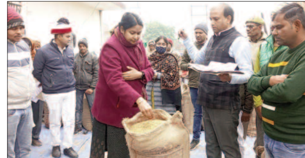
बारे में रखे धान की मानक को चेक करती डीएम

निरीक्षण के दौरान क्रय केन्द्र पर धान खरीद की स्थिति की जानकारी लेते हुए जंगीपुर एवं फतेहगढ़ जिले के