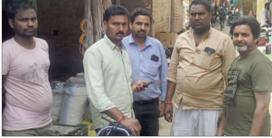
चोरी की घटना से दुकानदारों में मचा हड़कंप, मिठाई दुकान में चोरी के साथ की पार्टी