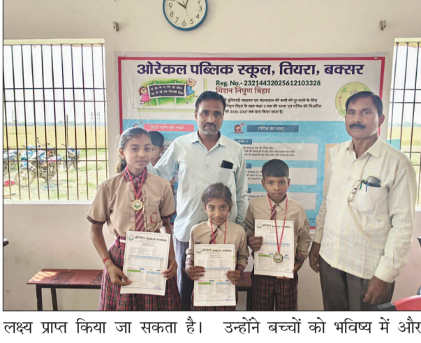
लक्ष्य प्राप्त किया जा सकता है। उन्होंने बच्चों को भविष्य में और

केटी न्यूज/राजपुर प्रखंड के तिवरा स्थित ओरेकल पब्लिक स्कूल में शैक्षणिक सत्र 2025-26 का वार्षिक परीक्षा परिणाम उत्साहपूर्ण माहौल में घोषित किया गया। परिणाम घोषणा के साथ ही विद्यालय परिसर में खुशी और उमंग का वातावरण देखने को मिला। छात्र-छात्राओं ने अच्छे अंकों के साथ सफलता हासिल की, जिससे उनके अभिभावकों और शिक्षकों में भी गर्व का भाव नजर आया। इस अवसर पर विद्यालय प्रबंधन द्वारा उत्कृष्ट प्रदर्शन करने