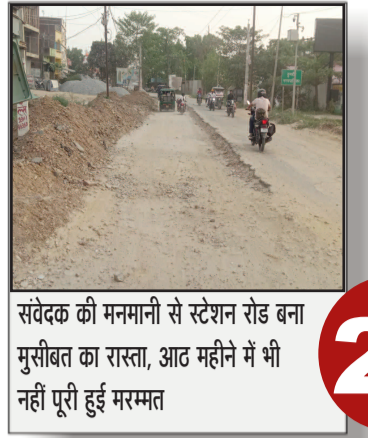
सर्वेदक की मनमानी से स्टेशन रोड बना मुसीबत का रास्ता. आठ महीने में भी नहीं पूरी हुई मरम्मत

प्रमुख खबरें : दिल्ली ■ पटना ■ बक्सर ■ शाहाबाद ■ मगध