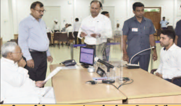
सीएम नीतीश कुमार ने कार्रवाई का दिया निर्देश