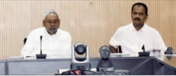
पटना के डीएम डेंगू संक्रमित, सीएम ने पूछा हालचाल

◆ सीएम नीतीश बोले- अस्पतालों में डेंगू की संख्या पर्याप्त मात्रा में उपलब्ध रहे, ब्लड बैंक में प्लेटलेट्स की उपलब्धता सुनिश्चित कराएं ताकि मरीजों को न हो कोई परेशानी