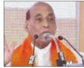
वसुधैव कुटुंबकम का संदेश देता है सनातन: राजनाथ सिंह ने कहा, सनातन धर्म को केवल पूजा पद्धति से जोड़कर नहीं देखा जा सकता है। सनातन धर्म वसुधैव कुटुंबकम का संदेश देता है और यह पूरे विश्व को एक परिवार मानता है। इसका न कोई जन्म है और न कोई

रक्षामंत्री राजनाथ सिंह ने राजस्थान के जैसलमेर में आयोजित चुनावी रैली में राहुल गांधी पर चुटकी लेते हुए कहा कि चंद्रयान सफलतापूर्वक लैंड कर गया, लेकिन 'राहुलयान' न कमी लॉन्च हुआ और न ही कमी लैंड हुआ। रक्षामंत्री ने काँग्रेस पर निशाना साधते हुए कहा, इन्हीं के गठबंधन के डीएमके नेता उदयनिधि स्टालिन ने चोट पहुंचाई है। काँग्रेस इस पर खामोश है। मैं सीएम महतो से पूछना चाहता हूँ कि वे इस मामले में कुछ बोलते क्यों नहीं हैं। सोनिया गांधी, राहुल गांधी और खरोगे चुप क्यों हैं?