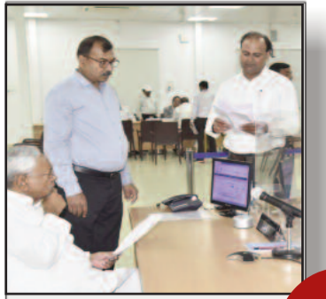
सीएम से फरियाद... मेरी जमीन हड़प रहे हैं दबंग