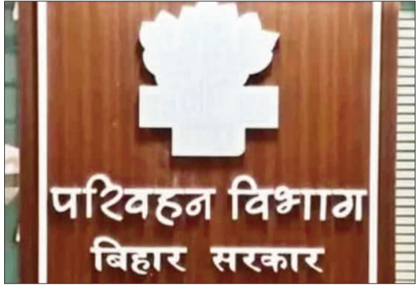
सर्वाधिक बढ़ोतरी दर्ज की गई है। इस उछाल के पीछे परिवहन मंत्री

बिहार राज्य परिवहन विभाग ने वित्तीय वर्ष 2025-26 में राजस्व संग्रहण के क्षेत्र में शानदार उपलब्धि हासिल की है। निर्धारित लक्ष्य 4070 करोड़ रुपये से काफी आगे निकलते हुए विभाग ने 4191.55 करोड़ रुपये का राजस्व प्राप्त किया है। इस प्रकार लक्ष्य से 103 प्रतिशत राजस्व जुटाकर विभाग ने एक नया रिकॉर्ड कायम किया है। विशेष रूप से विगत चार महीनों में राजस्व वसूली में लगातार