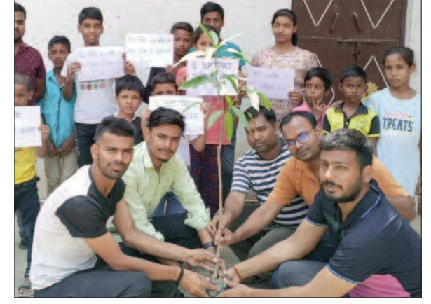
डुमरांव के बंधवा पटवा रोड के समीप पौधरोपण करते युवा।