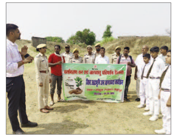
गोकुल जलाशय के समीप बच्चों को जानकारी देते नमामी गंगे के डीपीओ।