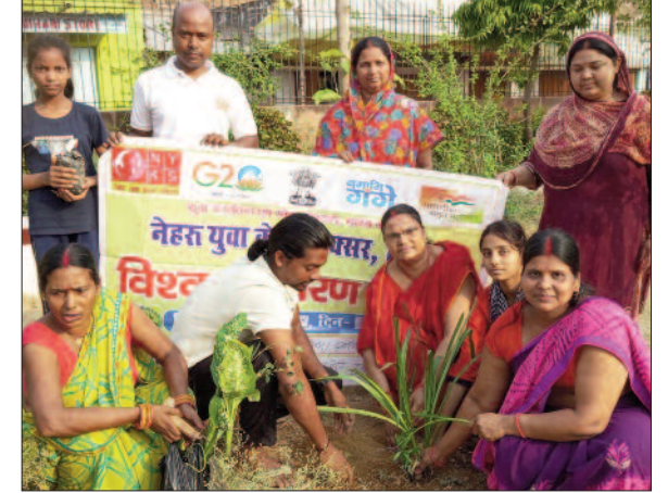
डुमरांव में पौधरोपण करते एनवाईके के सदस्य।