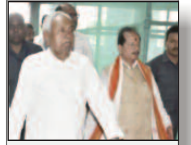
राज्य के चार जिलों में जल्द बनेंगे एयरपोर्ट: सीएम नीतीश कुमार