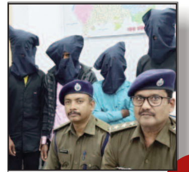
दो भाइयों ने मिलकर बहन के प्रेमी को कुल्हाड़ी से काट डाला