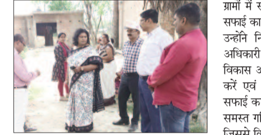
हेतु प्रेरित किया। मुख्य चिकित्साधिकारी ने सरायबीका, घोंसुआ खुर्द में संचारी रोग अभियान की भौतिक प्रगति के विषय में जानकारी लिया। उपरोक्त

जौनपुर। मुख्य चिकित्सा अधिकारी डॉ0 लक्ष्मी सिंह ने जनपद के सामुदायिक स्वास्थ्य केंद्र मछली शहर का भ्रमण किया। भ्रमण के दौरान उन्होंने टीकाकरण एवं संचारी रोग नियंत्रण अभियान की प्रगति का स्थलीय निरीक्षण भी किया। इस दौरान उन्होंने सामुदायिक स्वास्थ्य केंद्र के हेल्थ एंड वेलनेस सेंटर सरायबीका का भी निरीक्षण किया। हेल्थ एंड वेलनेस सेंटर पर साफ सफाई अच्छी थी एवं सभी दवाओं की पर्याप्त उपलब्धता भी थी। उन्होंने पास की मुसहर बस्ती का भ्रमण किया जहां टीकाकरण से इनकार के परिवार थे। ऐसे परिवारों को मुख्य चिकित्सा अधिकारी ने टीकाकरण