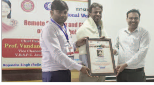
कि आज के समय में रिमोट सेंसिंग तकनीकी की मदद से भूस्खलन एवं अन्य आपदाओं के परिपेक्ष्य में अली वर्निंग सिस्टम डेवेलप करने में मदद मिल रही है जिस वजह से जनहानि एवं बचा जा सकता है। उन्होंने बताया कि हिमालय जैसे दुर्गम पहाड़ियों में जहां पर प्रत्यक्ष रूप से फील्ड करना संभव नहीं है वहां रिमोट सेंसिंग तकनीकी की

विस्तार से चर्चा की। उन्होंने कहा कि भारत एवं पड़ोसी देशों में हिमालयी परिक्षेत्र में भूस्खलन की घटनाएं प्रायः होती रहती हैं जिसका प्रमुख कारण पहाड़ों को काटकर बनने वाले रास्ते हैं। उन्होंने जोशी मठ में जमीन दरकने एवं सिलक्यारा - बारकोट सुरंग के धंसने की घटनाओं एवं उसके कारणों के बारे में विस्तार से चर्चा की। उन्होंने कहा कि नावें देश में पहाड़ी इलाकों में ओपन रोड से ज्यादा सुरंग के माध्यम से आवागमन को वरीयता दी जाती है जिससे वहां पर भूस्खलन आदि की घटनाएं भारत एवं पड़ोसी देशों की अपेक्षा बहुत ही कम है। उन्होंने कहा