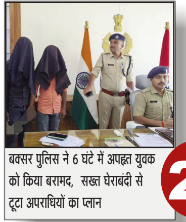
बक्सर पुलिस ने 6 घंटे में अपहृत युवक को किया बरामद, सख्त घेराबंदी से टूटा अपराधियों का प्लान

प्रमुख खबरें : दिल्ली ■ पटना ■ बक्सर ■ शाहाबाद ■ मगध