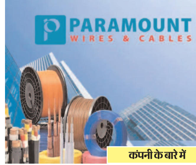
कंपनी के बारे में

नई दिल्ली, एजेंसी। शेयर बाजार की रिकॉर्ड बढ़त के बीच केबल-वायर बनाने वाली दिग्गज कंपनी पैरामाउंट कम्युनिकेशंस लिमिटेड के शेयर भी गुलजार हैं। बीते कुछ दिनों से इस शेयर में लगातार अपर सर्किट लग रहा है। सप्ताह के आखिरी कारोबारी दिन शुक्रवार को पैरामाउंट कम्युनिकेशंस के शेयर में 5 प्रतिशत का अपर सर्किट लगा और भाव 83 रुपये पर पहुंच गया। बता दें कि इस शेयर ने जनवरी 2024 में 52 हफ्ते के हाई को टच किया था। 23 जनवरी को शेयर की कीमत 116.70 रुपये तक गई थी। जुलाई 2023 में शेयर 34.15 रुपये के निचले स्तर पर था। यह शेयर के 52 हफ्ते का लो है। बीएसई एनालिटिक्स के अनुसार, पैरामाउंट केबल्स के शेयरों ने पिछले 10 वर्षों में अपने निवेशकों को 2,300 प्रतिशत से अधिक अमीर रिटर्न दिया है।