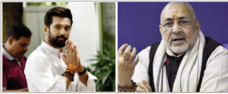
जितना कहेंगे उतनी आयु सरकार की बढ़ेगी: उपेंद्र कुशवाहा

केंद्रीय मंत्री चिराग पासवान लालू प्रसाद के उस बयान पर पलटवार किया, जिसमें लालू ने दावा किया था कि केंद्र की सरकार अगस्त महीने में गिर जाएगी। लालू के इस बयान पर चिराग ने कहा कि पांच साल तक सरकार चलेगी, उन्हें परेशान होने की जरूरत नहीं है। उन्होंने कहा कि लालू प्रसाद को इतनी जल्दबाजी करने की जरूरत नहीं है, अभी इतिहास से रहे। पीएम मोदी के नेतृत्व में एनडीए का हर एक घटक दल पूरी मजबूती से इस सरकार के साथ है। आगामी बिहार विधानसभा चुनाव को लेकर चिराग ने कहा कि जहां तक बिहार विधानसभा चुनाव की बात है तो हमलोग नीतीश कुमार के नेतृत्व में पूरी मजबूती के साथ चुनाव लड़ेंगे।