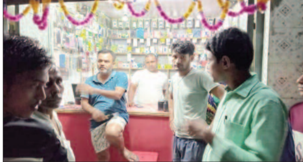
घटना के बाद दुकान के बाहर चर्चा करते स्थानीय ग्रामीण।

शुक्रवार की देर शाम मुरार थाना क्षेत्र के चौगाई गांव के पंजाब नेशनल बैंक से कुछ दूरी पर पहला मोड़ के पास स्थित निशा मोबाइल दुकान से हथियारबंद लूटेरों ने दो लैपटॉप लूट लिए। जानकारी के अनुसार तीन की संख्या में लूटेरे ग्राहक बन दुकान में आए थे तथा दुकानदार से मोबाइल पर कवर ग्लास लगाने की बात कह उसे पहले उलझाने का प्रयास किए तथा इसी दौरान उनकी नजर दुकान के अंदर रखे लैपटॉप पर पड़ी। एक लूटेरे ने अपने कमर से देशी कट्टा निकाल दुकानदार के कनपटी पर सटा दिया तथा उसके दो अन्य साथी एक एक लैपटॉप उठा लिए। दुकानदार कुछ समझ पाता तथा मदद की गुहार लगाता तबतक हवा में कट्टा लहराते हुए तीनों अपराधी पतली गली के रास्ते भाग निकले। उनके जाने के बाद दुकानदार ने आस पास के दुकानदारों तथा