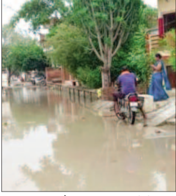
थी। इस मार्ग और हनुमानगढ़ी तिराहे के पास से लेकर 100 मीटर के आसपास सड़कें

केटी न्यूज / गाजीपुर दुल्लहपुर थाने के हनुमानगढ़ी मोहल्ला और रेलवे स्टेशन रोड मार्ग नाबदान के पानी और बारिश के पानी से जलमन हो चुका है। यह कोई नई बात नहीं है। दुल्लहपुर शंकर सिंह ग्रामसभा में हनुमानगढ़ी मोहल्ला की आबादी लगभग 1000 के आस-पास है। इस मार्ग का इंटरलॉकिंग जव सतगुरु देव आश्रम के पास और गाजीपुर आजमगढ़ राजमार्ग से हमीद मार्ग तक लगभग पांच साल पूर्व रेलवे विभाग में इंटरलॉकिंग सड़क बनाई