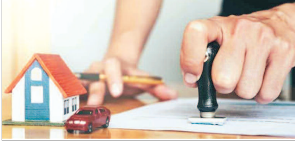
मध्य प्रदेश ने 8 फीसदी से घटाकर 7.5 फीसदी किया है। 3 से 7 फीसदी था। छत्तीसगढ़ ने 8 से घटाकर पांच फीसदी किया है। हरियाणा ने बढ़कर 5 से 7 फीसदी कर दिया है जो पहले फीसदी किया है।