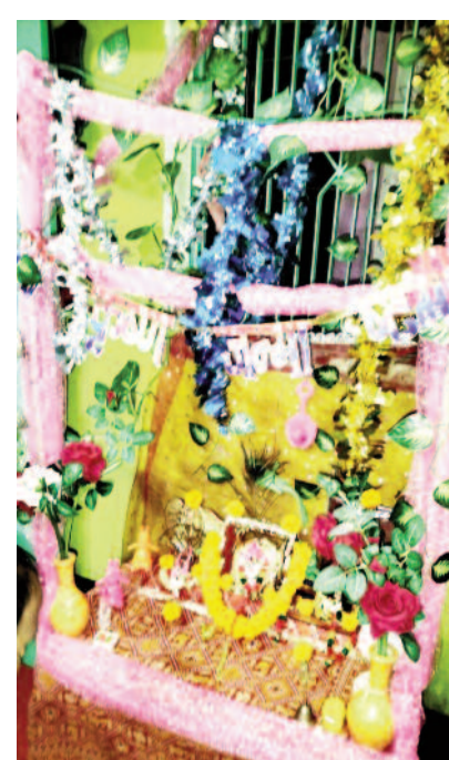
जन्माष्टमी पर सजाया गया झूला।