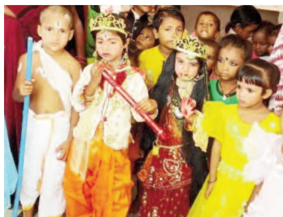
श्री कृष्ण, राधा और सुदामा बने बच्चे