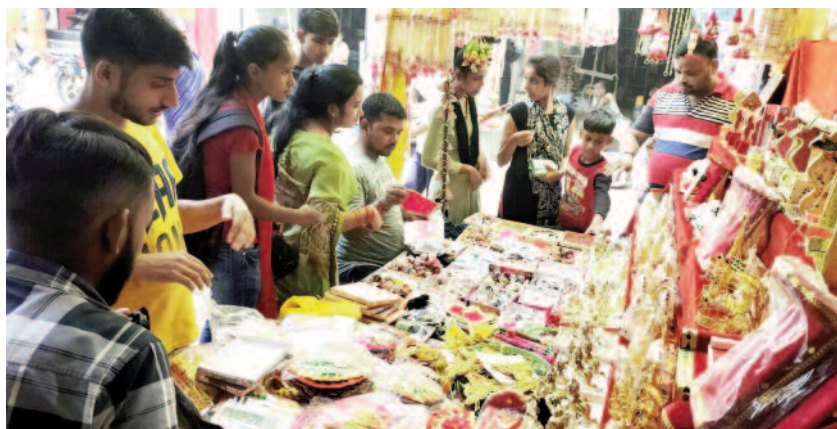
श्री कृष्ण जन्माष्टमी के अवसर पर दुकान से सजावट की सामग्री खरीदते लोग।