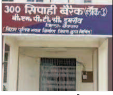
अनुशासन पर ध्यान दिया जाए।

अपर पुलिस महानिदेशक प्रशिक्षण ने बीएसएपी-4 व एमपीटीसी के समादेश को भेजा निर्देश का पत्र