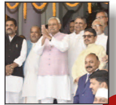
बिहार विधानसभा का पांच दिवसीय शीतकालीन सत्र शुरू