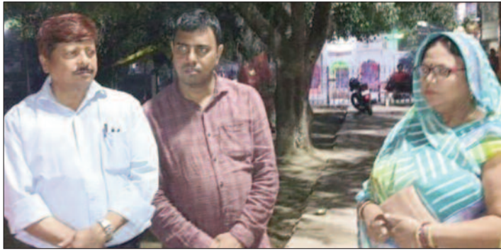
पहले ही कायाकल्प होंगे। नप सूत्रों ने बताया कि दीपावली और छठ महापर्व पर शहर के साफ-सफाई के साथ ही घाटों को चिन्हित कर बेहतर तरीके से सफाई का कार्य शुरू होगा। गंदे पानी की सफाई के लिए चुना आदि का उपयोग होगा। सफाई के लिए नप