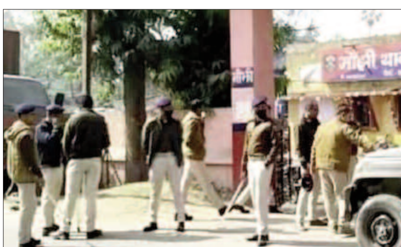
घटना से गुस्साए लोगों ने मुखिया के घर में की तोड़फोड़-अगजनी