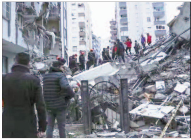
मौल) की गहराई पर सुबह 4:17 बजे आया। भूकंप से गाजियतपे, सान्लिउर्फा, दिवारवाकिए, अदाना, अदियामन, मालट्या, उस्मानिया, हटे

● सोमवार की सुबह 7.8 की तीव्रता का इस सदी का सबसे शक्तिशाली भूकंप आया