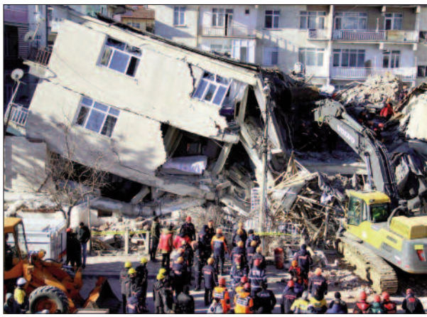
बचाव कार्य के लिए भारत से रवाना होगा 100 सदस्यीय दल: प्रधानमंत्री नरेंद्र मोदी समेत विश्व के कई नेताओं ने घटना पर शोक व्यक्त किया। पीएम मोदी ने ट्वीट किया कि तुर्की (तुर्की) में भूकंप के कारण जान-माल के नुकसान से दुखी हूं। शोक संतप्त परिवारों के प्रति संवेदना।

● तुर्की में 12 घंटों में अलग-अलग तीव्रता के 46 भूकंप के झटके महसूस किए गए