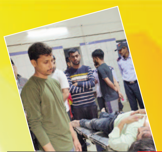
गाड़ी पार्किंग के विवाद में दो पक्षों में हुई मारपीट, आधा दर्जन जख्मी

प्रमुख खबरें : पटना ■ भोजपुर ■ बक्सर ■ रोहतास ■ पूर्वांचल ■ मिथिलांचल ■ विविध ■ खेल ■ आर्थिक