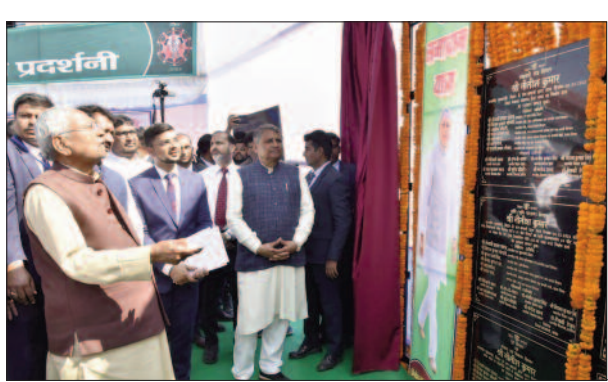
लिया और ठाकुर स्वर्णकार हस्तकला उद्योग, मनिया में चांदी से निर्मित मछली को देखा। उन्होंने 1304 जीविका समूहों को व्यवसाय हेतु 1 करोड़ 67 लाख रुपये का सार्वजनिक चेक प्रदान किया।

मुख्यमंत्री नीतीश कुमार ने सोमवार को समाधान यात्रा के क्रम में बांका जिले में विभिन्न विभागों के अंतर्गत चल रही विकास योजनाओं का जायजा लिया। यात्रा के दौरान मुख्यमंत्री कटोरिया प्रखंड के मनिया गांव पहुंचे और वहां संकेतिक बाल विकास परियोजना केंद्र पर बच्चे-बच्चियों से बात कर वहां की व्यवस्थाओं के संबंध में जानकारी ली। उन्होंने वहां उपस्थित मनिया ग्रामवासियों की समस्याएं सुनीं और अधिकारियों को समाधान के निर्देश दिए। इसके पश्चात मुख्यमंत्री ने जिला औद्योगिक नवप्रवर्तन योजना के अंतर्गत स्थापित क्लस्टर का जायजा