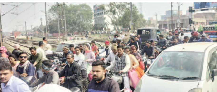
दुमरांव रेलवे फाटक के पास लगी वाहनों की लंबी कतार