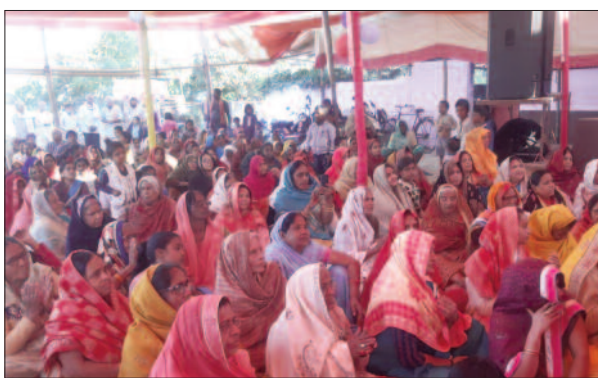
कथा श्रवण को जुटी श्रद्धालुओं की भीड़

करके उनके आज्ञानुसार कार्य करना चाहिए, जिससे भविष्य अत्यंत उज्ज्वल हो जाता है। ऐसा करने से उनका आयु, विद्या, यश और बल में वृद्धि होती है। भगवान राम के बाल्यावस्था से लेकर किशोरावस्था तक के प्रसंग बड़े ही सरल एवं रोचक ढंग से प्रस्तुत किया। कहा कि