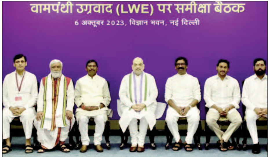
वामपंथी उग्रवाद (LWE) पर समीक्षा बैठक 6 अक्टूबर 2023, विज्ञान भवन, नई दिल्ली

वामपंथी उग्रवाद पर आयोजित समीक्षा बैठक में केंद्रीय गृहमंत्री अमित शाह का बड़ा बयान दिया है। उन्होंने कहा कि दो वर्ष में देश से वामपंथी उग्रवाद का पूरी तरह सफाया हो जाएगा। वामपंथी उग्रवाद प्रभावित राज्यों में सुरक्षा स्थिति की समीक्षा के लिए आयोजित एक बैठक की अध्यक्षता करते हुए अमित शाह ने यह भी कहा कि वर्ष 2022 में पिछले चार दशकों में नक्सल प्रभावित क्षेत्रों में हिंसा और मौतों की सबसे कम घटनाएं हुईं। केंद्रीय गृहमंत्री अमित