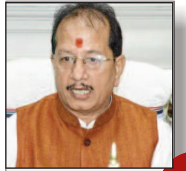
सत्ता के संरक्षण में हो रहा पेपर लीक