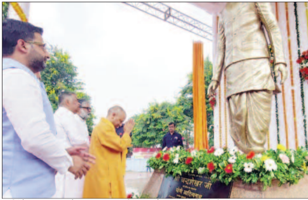
मूर्ति के अनावरण के बाद पुष्प अर्पित करते मुख्यमंत्री योगी