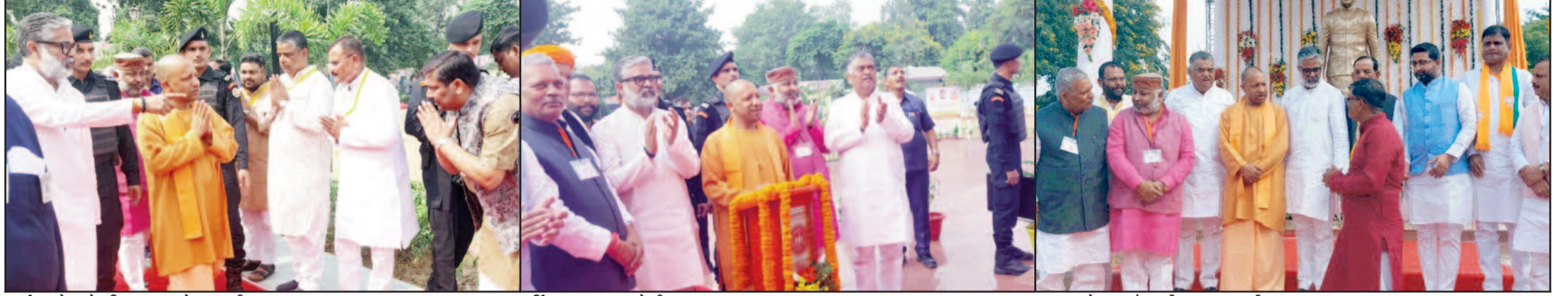
कार्यक्रम से पहले परिचय प्राप्त करते मुख्यमंत्री