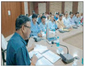
बैठक में शामिल अधिकारी

मुख्य विकास अधिकारी प्रकाश गुप्ता की अध्यक्षता में उत्तर प्रदेश शासन द्वारा निर्धारित महत्वपूर्ण 37 बिंदुओं पर विकास कार्यों की समीक्षा बैठक जिला पंचायत सभागार में संपन्न हुई। बैठक में उन्होंने समस्त संबंधित विभागों से जुड़ी योजनाओं की माह प्रगति के बारे में समीक्षा की। समीक्षा के दौरान उन्होंने संबंधित अधिकारी को निर्धारित समय सीमा में विभागीय विकास परक योजनाओं एवं निमार्णाधीन परियोजनाओं को पूरा करने के संबंधित अधिकारी को निर्देश दिया। उन्होंने जनपद के प्रत्येक पात्र परिवार के व्यक्तियों का गोलडन कार्ड बनाते हुए इसमें तेजी लाने तथा जनपद के झोला छाप