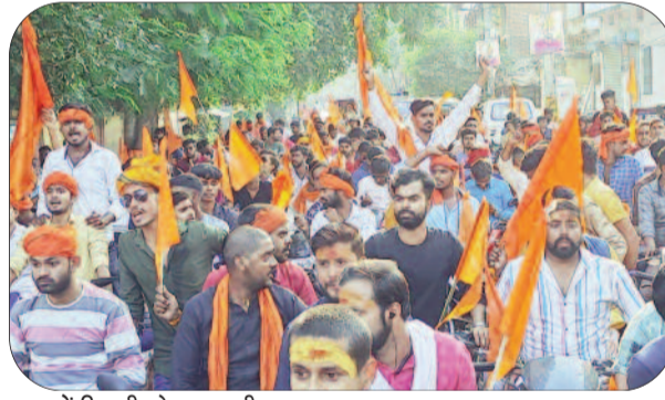
शहर में निकली शोभायात्रा की जुलूस

आदि में भ्रमण करते हुए वापस माता अहिल्या धाम अहिरोली पहुँची। 15 किलोमीटर की यात्रा चार घंटों में