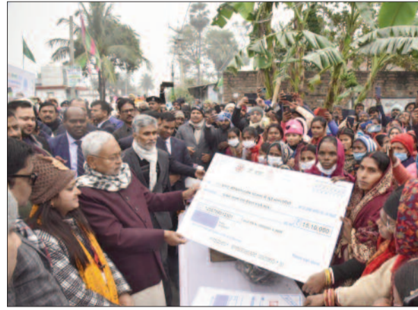
यात्रा के दौरान जीविका दीर्घियों को चेक करते सीएम

यात्रा से सबसे पहले उन्होंने हरसेरा गांव में मजार पर चादरपोशी