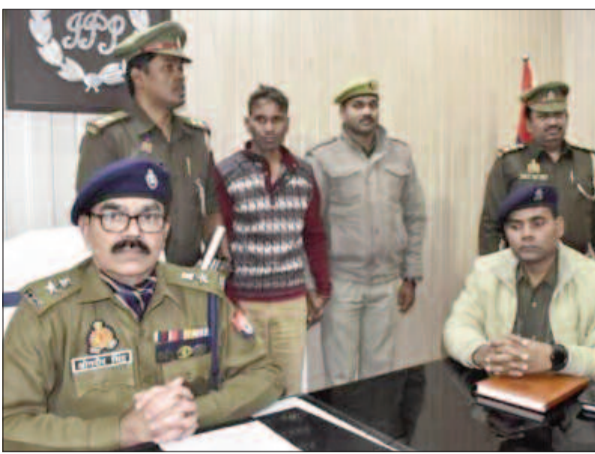
सेवार्ता में जानकारी देते एसीपी

नगर व क्षेत्राधिकारी भुइकुड़ा के कुशल पर्यवेक्षण में थाना दुल्लहपुर पुलिस के द्वारा थाना क्षेत्र में सक्रिय एक फर्जी उपनिरीक्षक की सूचना प्राप्त हुई थी। इसके आधार पर थाना पुलिस दिनांक एक जनवरी 2023