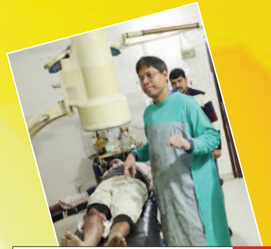
दबंगई: भोजपुर में बालू घाट के रास्ता के विवाद में फायरिंग, एक को लगी गोली

प्रमुख खबरें : पटना ■ भोजपुर ■ बक्सर ■ रोहतास ■ पूर्वांचल ■ मिथिलांचल ■ विविध ■ खेल ■ आर्थिक