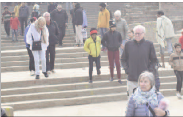
रामरेखा घाट पर घुमते सैलानी

मैदान में पहुंचे। जहां से वापस दो घंटे बाद पुनः रामरेखा घाट पर पहुंचे और उन्हें लेकर क्रूज आगे की तरफ से प्रस्थान कर गया। इस दौरान बक्सरवासियों में भी क्रूज व उसके यात्रियों को देखने के लिए कीतूहल