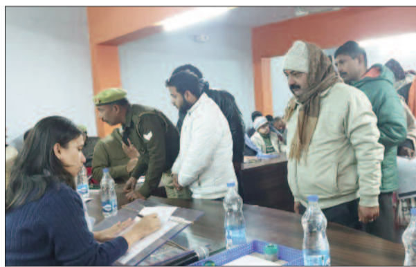
समाधान दिवस पर लोगों की फरियाद सुनी जिलाधिकारी