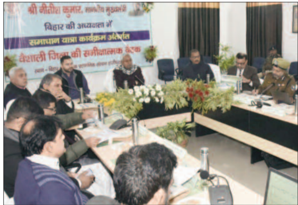
अधिकारियों के साथ बैठक करते सीएम व डिप्टी सीएम

वर्ष 2010 के बाद वर्ष 2011 में केन्द्र सरकार ने एक हद तक जनगणना के बाद इस संबंध में कुछ करने की कोशिश की लेकिन लापता है, वो ठीक ढंग से नहीं हो पाया। जिसके कारण उसे प्रचारित भी नहीं किया गया। हमलोग पहले से ही कह रहे हैं कि जाति आधारित गणना पूरे देश में एक ही साथ करावें, जैसे