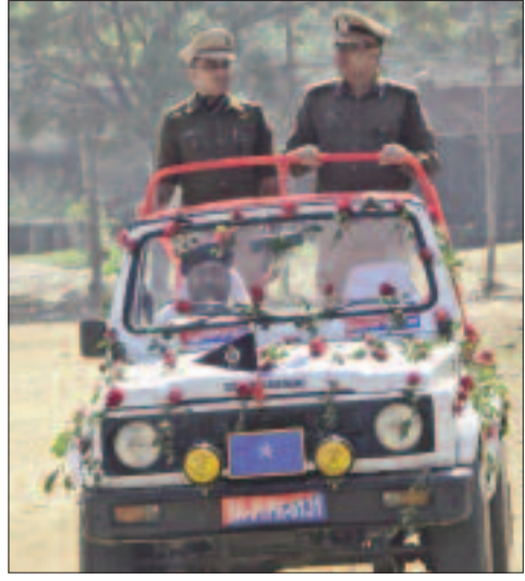
परेड का अवलोकन करते डीआईजी व एसपी।