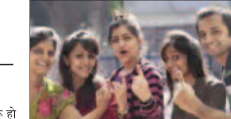
होली से पहले आगयी आयोग की टीम: चुनाव आयोग की टीम बिहार में चुनावी तैयारियों का जायजा लेने आ रही है। यह टीम होली से पहले दो दिनों के लिए बिहार आएगी। इस दौरान वे जिला पदाधिकारियों, मुख्य सचिव और पुलिस महानिदेशक के साथ बैठक करेंगे। इन बैठकों में आयकर विभाग, उत्पाद विभाग और अन्य संबंधित एजेंसियों के अधिकारी भी मौजूद रहेंगे। इस दौर का मुख्य उद्देश्य चुनाव की तैयारियों की समीक्षा करना है। इस बार बिहार विधानसभा चुनाव नवंबर में होने की उम्मीद है। चूंकि अक्टूबर में दिवाली और छठ जैसे प्रमुख त्योहार हैं, इसलिए चुनाव आयोग त्योहारों के बाद ही मतदान करेगा। इसके लिए तैयारी शुरू हो गई है। यह सुनिश्चित करने के लिए किया जाएगा कि मतदान प्रक्रिया निष्पक्ष और पारदर्शी हो। चुनाव आयोग की टीम पटना में अधिकारियों के साथ बैठक करने के अलावा, राज्य के अन्य जिलों का भी दौरा करेगी। भागलपुर और मुजफ्फरपुर जैसे जिलों में जाकर वे स्थानीय अधिकारियों के साथ बैठक करेंगी।

♦ चुनाव की तारीखों की घोषणा सितंबर के आखिर में होने की संभावना