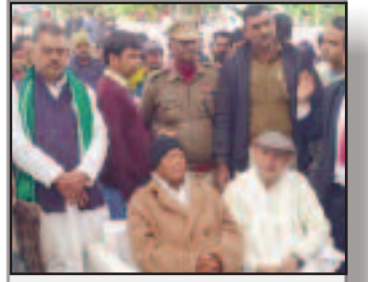
लैंड फॉर जॉब : विशेष अदालत ने सीबीआई से मांगा स्पष्टीकरण