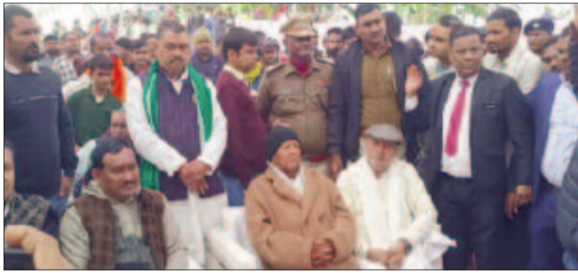
एजेंसी के अनुसार, रेलवे में नौकरी देने के बदले उम्मीदवारों से जमीन की रिश्त ली गई। ये जमीनें लालू प्रसाद यादव के परिवार के सदस्यों या उनके करीबियों के नाम पर गिफ्ट या ट्रांसफर कराई गई थीं। सीबीआई के मुताबिक, जब लालू प्रसाद यादव रेल मंत्री थे, उस दौरान पश्चिम मध्य रेलवे, जबलपुर (मध्य प्रदेश) में गुप-डी की नौकरियों के बदले लोगों से जमीन ली गई। इस मामले में लालू यादव, उनकी पत्नी राबड़ी देवी, दो बेटियां, कुछ अज्ञात सरकारी अधिकारी और निजी व्यक्तियों के खिलाफ मामला दर्ज किया गया था। सीबीआई ने यह मामला 18 मई 2022 को दर्ज किया था। जांच में यह सामने आया कि रेलवे की नौकरी पाने वालों ने या तो अपनी जमीनें लालू परिवार के किसी सदस्य के नाम ट्रांसफर कीं या बेहद सस्ते दामों पर बेचीं।

♦ अदालत 17 फरवरी को इस पर निर्णय लेगी कि चार्जशीट पर संज्ञान लिया जाए या नहीं