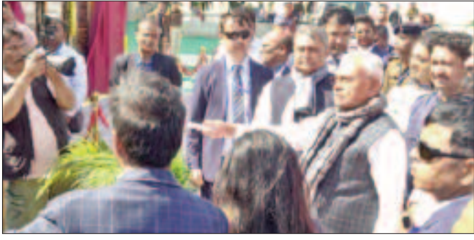
जल जीवन हरियाली अभियान, शिक्षा, मुख्यमंत्री गढ़ी थाना क्षेत्र के धावाटांड महिला सशक्तिकरण और खेल सुविधाओं से संबंधित परियोजनाएं शामिल हैं।

♦ जमुई को सीएम नीतीश ने दी बड़ी सौगात, 890 करोड़ की विकास योजनाओं का किया शिलान्यास और उद्घाटन