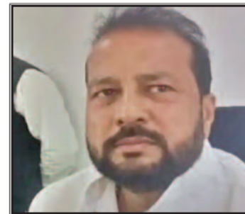
पटना में राजद एमएलसी के टिकानों पर छापा