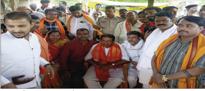
नारेबाजी और फूल-मालाओं से माहौल पूरी तरह राजनीतिक जोश से भर गया।

दुर्गा मंदिर के पास हुआ जोरदार स्वागत, 15 मिनट के ठहराव में मजदूरों के अधिकारों पर दिया भरोसा