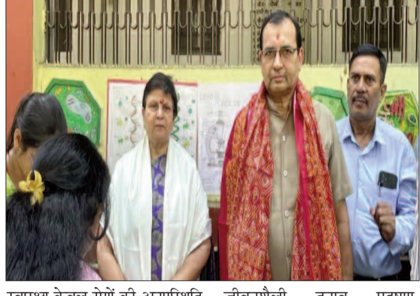
स्वास्थ्य केवल रोगों की अनुपस्थिति नहीं है, बल्कि शारीरिक, मानसिक और सामाजिक रूप से पूर्ण रूप से स्वस्थ होना ही वास्तविक स्वास्थ्य है। आज के समय में बदलती