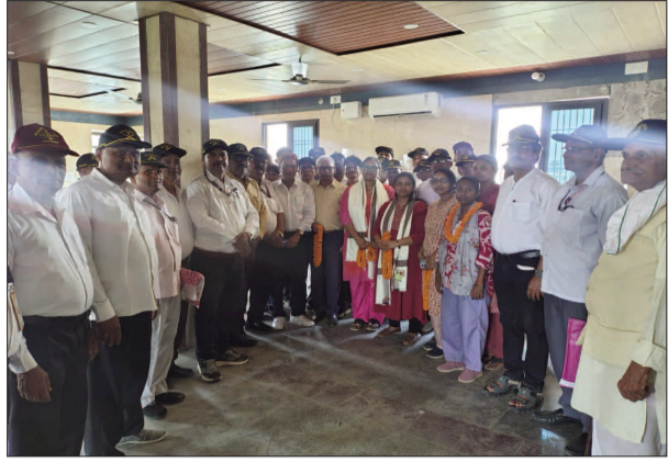
आयोजित एक कार्यक्रम में नव-नियुक्त चिकित्सकों का स्वागत करते हुए इस पहल के लिए आभार जताया गया।

लंबे समय से डॉक्टरों के अभाव से जूझ रहे थे लाभार्थी, आईईएसएम के प्रयास से बहाल हुई स्वास्थ्य सेवाएं