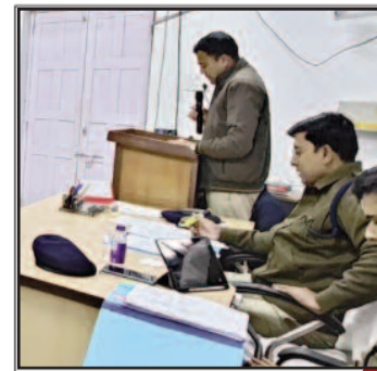
पेंडिंग केस की संख्या को हर हाल में ढ़ाई गुणा से कम करें