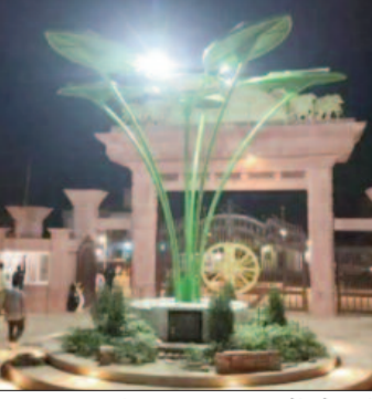
है। फिलहाल, करीब 70 प्रतिशत कार्यों को पूर्ण कर लिया गया है और 22 जनवरी से पहले ही निर्धारित लक्ष्य को प्राप्त करके वर्ल्ड रिकॉर्ड कायम कर लिया जाएगा। अयोध्या का नाम यूं तो दीपोत्सव को लेकर पहले ही गिनीज बुक ऑफ वर्ल्ड रिकॉर्ड में दर्ज है, मगर अब अयोध्या में सौर ऊर्जा के जरिए जल्द ही पूरा कर लिया जाएगा। परियोजना के अंतर्गत लक्ष्यन घाट से गुप्तार घाट तक 310 सोलर लाइट्स को इम्पैल्ड करके रोलआउट कर दिया गया है। जबकि गुप्तारघाट से लेकर निर्मली कुंड तक 1.85 किमी के स्ट्रेच में 160 सोलर पावर्ड स्ट्रीट लाइटों को लगाने का कार्य जारी है। यह सभी सोलर पावर्ड स्ट्रीट लाइटें एलईडी बेस्ड हैं जो कि 4.4 वॉट पावर पर कार्य करती हैं तथा स्मार्ट टेक्नोलॉजी युक्त हैं। इनके इंस्टॉलेशन के जरिए लक्ष्यन घाट से लेकर निर्मली कुंड तक 10.2 किमी का स्ट्रेच दूधिया रोशनी से जगमा उठेगा।

सूर्यवंश की गौरवशाली राजधानी अब सूर्य की ही आभा से नव-भय-स्वरूप को प्राप्त करने के साथ ही वैश्विक कीर्तिमान स्थापित करने की दिशा में भी तेजी से आगे बढ़ रही है। अयोध्या को सीएम योगी आदित्यनाथ के विजन के अनुसार जिस सोलर सिटी के मांडल के तौर पर प्रोजेक्ट किया जा रहा है, उसका जल्द ही गिनीज बुक ऑफ वर्ल्ड रिकॉर्ड्स में भी उल्लेख होने वाला है। सीएम योगी के दिशा-निर्देशन में बनी विशिष्ट कार्ययोजना को क्रियान्वित करते हुए उत्तर प्रदेश नवीन एवं नवीकरणीय ऊर्जा विकास अभिकरण (यूपीनेडा) जल्द ही 'दुनिया की सबसे बड़ी सोलर पावर्ड स्ट्रीट लाइट्स लाइन' परियोजना को पूर्ण करके वैश्विक कीर्तिमान स्थापित करने की दिशा में तेजी से प्रयास कर रहा है। इस परियोजना के तहत 10.15 किमी के स्ट्रेच में 470 सोलर पावर्ड स्ट्रीट लाइट्स लगाकर यूपीनेडा अयोध्या की गौरवगाथा में एक नया अध्याय जोड़ने जा रही है।