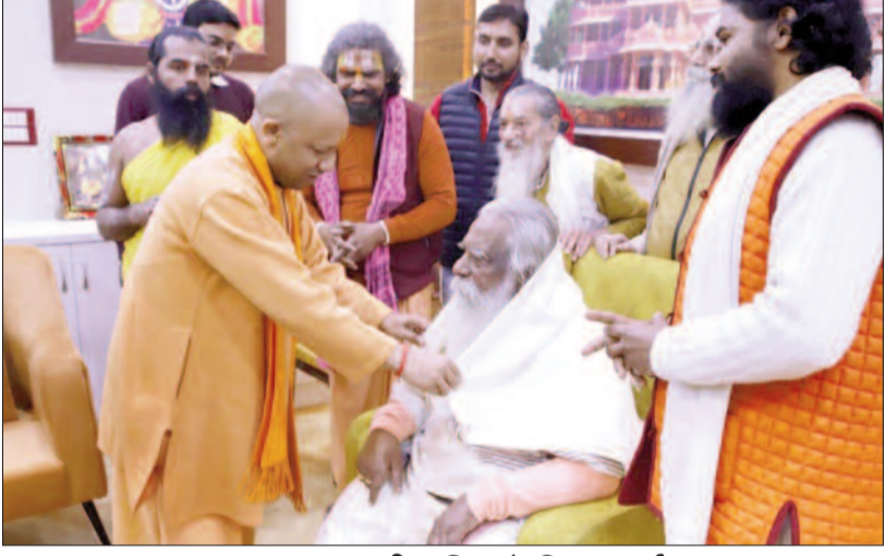
रामलला व हनुमानगढ़ी मंदिर में किया दर्शन-पूजन

2024 में मुख्यमंत्री योगी आदित्यनाथ का पहला अयोध्या दौरा भी विकास और स्वच्छता को ही समर्पित रहा। उन्होंने अफसरों को निर्देश दिया कि रामनगरी स्वच्छता व सुंदरतम नजर आए। यहां भी स्वच्छता का कुंभ मांडल लागू करें। सड़कों भी कहीं भी धूल उड़ती न देखे, शौचालयों की प्रतिदिन सफाई हो। मंगलवार को यहां उन्होंने विकास कार्यों की हकीकत देखी। बारीकी से कार्यों का निरीक्षण किया और साधु-संतों का हाल चाल भी जाना। मुख्यमंत्री कुबेर टीला भी गए, जहां जटायु को नमन किया। वहीं विकास कार्यों को लेकर अफसरों को निर्देश दिया कि 22 जनवरी के बाद यहां श्रद्धालुओं व पर्यटकों की संख्या में तेजी से वृद्धि होगी। लिहाजा हर काम गुणवत्तापूर्ण और समय से हो। लापरवाही कर्तई बर्दाश्त नहीं होगी। तीर्थ क्षेत्र पुरम में मुख्यमंत्री को ट्रस्ट के महासचिव चंपत राय ने ट्रस्ट द्वारा विकसित टेंट सिटी का भ्रमण कराकर व्यवस्थाओं से अवगत कराया। यहां महंत अवेधनाथ जी नगर, ओंकार भावे नगर, वामदेव जी महाराज नगर सहित सभी नगरों में भ्रमण कर व्यवस्था देखी और कहा कि साफ-सफाई को शीर्ष प्राथमिकता दें। कुंभ जैसी स्वच्छता व्यवस्था हो। नगर निगम की टेंट सिटी का भी किया निरीक्षण: मुख्यमंत्री योगी आदित्यनाथ ने नगर निगम द्वारा बनाई जा रही टेंट सिटी का अवलोकन किया। 22 जनवरी के बाद रामनगरी में आने वाले दर्शनार्थियों के रहने की व्यवस्था के दृष्टिगत मुख्यमंत्री ने निर्देश दिया कि बरसात के मौसम में यहां दिक्कत न हो, इसका ध्यान रखा जाय। उन्होंने कहा कि यहां चौखट थोड़ा ऊंचा कराया जाए। इसके साथ ही मुख्यमंत्री ने कहा कि महिला/पुरुष शौचालयों की नियमित साफ सफाई हो, किसी प्रकार की दुर्व्यवस्था न हो।