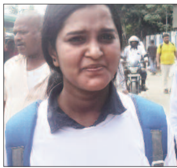
भ्रमण कर टीबी मरीजों के बीच उनकी काउंसलिंग करती हैं। काउंसलिंग की मदद से टीबी रोग से उबरने के लिए उनकी

रोग से उबरने के लिए टीबी मरीजों की करती हैं काउंसलिंग