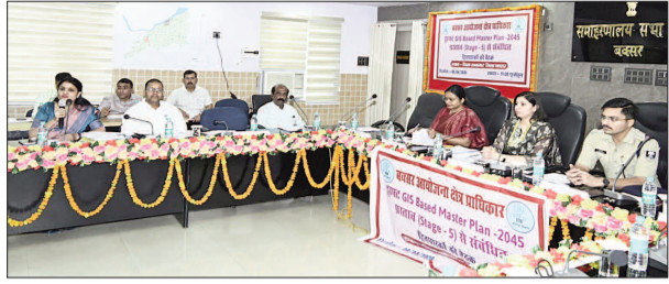
■ समाहरणालय स्थित सभाकक्ष में बक्सर आयोजना क्षेत्र से संबंधित एक महत्वपूर्ण बैठक आयोजित की गई, जिसमें वर्ष 2045 को ध्यान में रखते

■ जिलाधिकारी की अध्यक्षता में बैठक, मास्टर प्लान के पांचवें चरण पर मंथन; स्थानीय जरूरतों के अनुरूप सुझाव शामिल करने के निर्देश