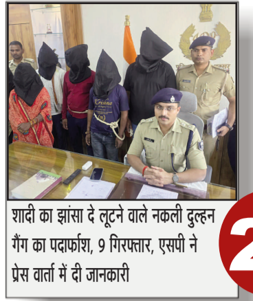
शहीदी का झंसा दे लूटने वाले नकली दुल्हन गैंग का पदाफाश, 9 गिरफ्तार, एसीपी ने प्रेस वार्ता में दी जानकारी