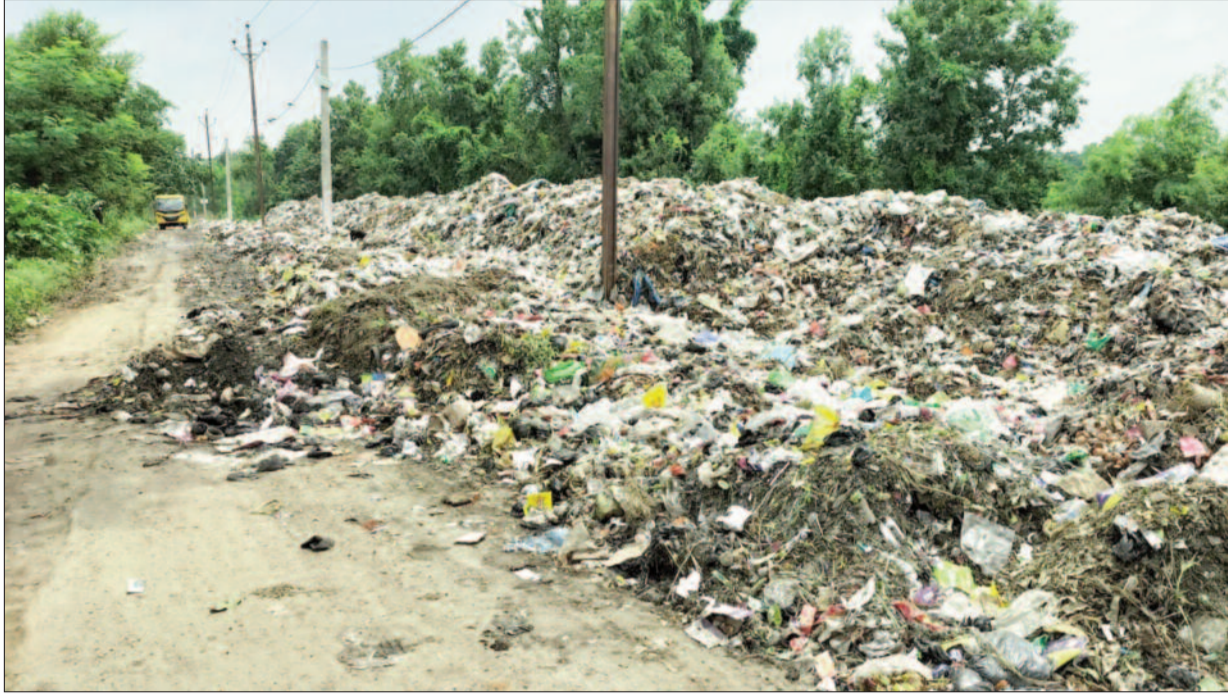
वार्ड नंबर 33 स्थित नहर मार्ग में सड़क के करीब 100 मीटर के दायरे में कचरे का अंबार लगा हुआ है। इधर से ही स्कूल समेत कई वाहन गुजरते हैं।

सूबे को स्वच्छ व सुंदर बनाने के लिए राज्य सरकार द्वारा इन दिनों लोहिया स्वच्छ बिहार अभियान का दूसरा फेज चलाया जा रहा है। जिसके तहत गांवों में भी अब स्वच्छता की अलख जगाई जा रही है। हर पंचायतों में अब शहरों की तर्ज पर डोर टू डोर कूड़ा का उठाव किया जा रहा है। कूड़ा कचरा के समुचित निस्तारण के लिए वेस्ट प्रोसेसिंग यूनिट का निर्माण भी युद्ध स्तर पर चल रहा है। बता दें कि इसके पहले फेज में शहरी क्षेत्रों में भी वेस्ट प्रोसेसिंग यूनिट बनवाया गया था। लेकिन ताज्जुब है कि डुमरांव नगर परिषद क्षेत्र में अभी तक वेस्ट प्रोसेसिंग यूनिट घरातल पर नहीं उतर सका है। जिस कारण लोगों के घरों से निकलने वाले कचरे को सफाई कर्मी विभिन्न सड़कों के किनारे यूं ही फेंक रहे हैं। लिहाजा हर महीने लाखों खर्च के बावजूद शहर में स्वच्छता अभियान का परिणाम सिफर नजर आ रहा है।