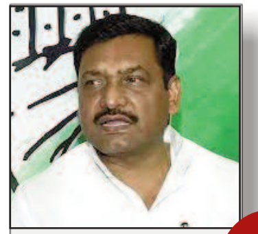
बिहार की 9 सीटों पर उम्मीदवार खड़ा करेगी कांग्रेस: अखिलेश