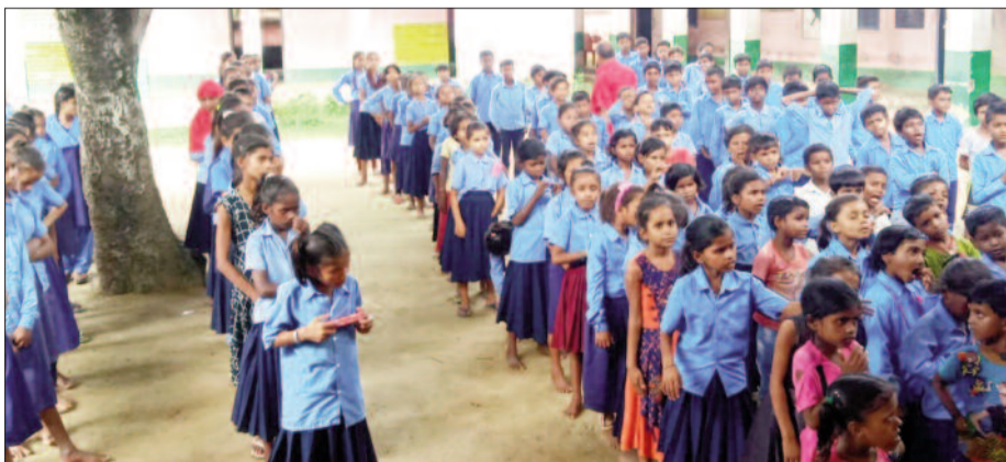
स्वच्छता की शपथ लेते स्कूली बच्चे

सार्वजनिक स्थलों, धार्मिक स्थलों, स्कूल आदि विभिन्न जगहों पर व्यापक सफाई अभियान चलाया गया। जिसका संचालन ग्राम स्तर पर कार्यरत स्वच्छग्रही, स्वच्छता कर्मी, स्वच्छता पर्यवेक्षक, जन-प्रतिनिधि