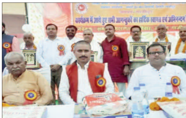
सम्मेलन में शामिल शिक्षकगण

जिला मुख्यालय में शनिवार को उत्तर प्रदेश माध्यमिक शिक्षणोत्तर संघ का जिला सम्मेलन और जनपदीय