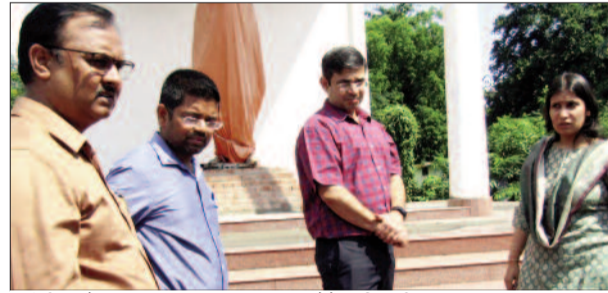
पूर्व पीएम के अनावरण स्थल का जायजा लेते अधिकारी