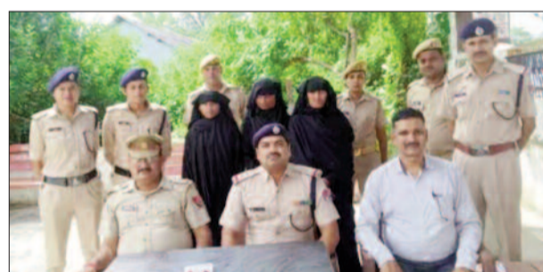
पकड़ी गई महिला गैंग