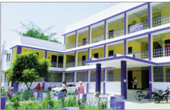
अनुमंडल पुलिस मुख्यालय

नाराजगी देखी जा रही है। विफलता पर बड़े अधिकारी की भी फजीहत झेलनी पड़ती है। लूट के मामलों में अनुमंडल की पुलिस ने अपराध पर नियंत्रण को लेकर मंथन शुरू कर दिया है। इसके लिए अलग से पुलिस