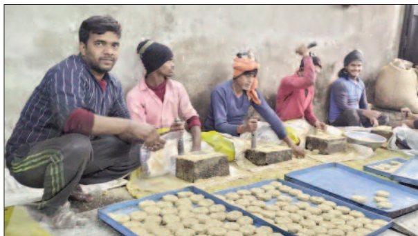
तिलकुट बनाते कारीगर

दी है। आगामी 15 जनवरी को मकर संक्रांति का त्योहार मनाया जायेगा। शहर के स्टेशन रोड, गोला रोड, चौक रोड, जंगल बाजार मंडी में तिलकुट की दुकानें सज गयी हैं। इस