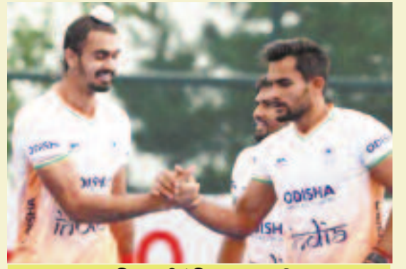
एशियाई चैंपियंस ट्रॉफी

9,685 रन बनाए हैं। स्मिथ ने आगे बताया कि दोनों खिलाड़ी अक्सर एक-दूसरे को बात करते हैं, और वो 22 नवंबर से शुरू हो रही बॉर्डर-गावस्कर ट्रॉफी में कोहली का सामना करने के लिए उत्साहित हैं।