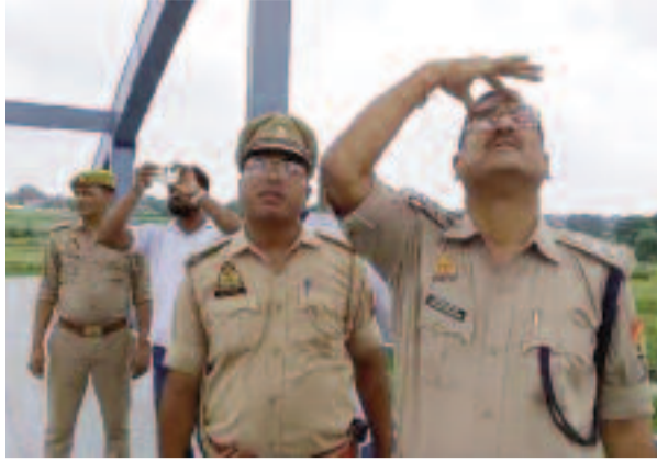
प्रांत के समस्तीपुर का रहने वाला है।