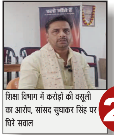
शिक्षा विभाग में करोड़ों की वसूली का आरोप, सांसद सुधाकर सिंह पर घिरे सवाल