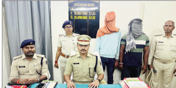
पुलिस पर हमले के दो आरोपी गिरफ्तार हुए हैं। दोनों शराब तस्कर हैं। इन पर पूर्व से भी शराब तस्करी के दो मामले दर्ज हैं। हथियार और जिंदा कारतूस भी बरामद हुए हैं। इस कांड की यह तीसरी गिरफ्तारी है। शेष अभियुक्तों को भी चिन्हित किया जा रहा है।

घटना में शामिल तीन अपराधी अबतक हो चुके हैं गिरफ्तार, अन्य की तलाश में छापेमारी तेज