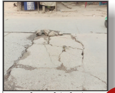
मरम्मत की खानपूरी के बीच डेंजर बना डुमरांव का स्टेशन रोड, कभी भी हो सकता है बड़ा हादसा