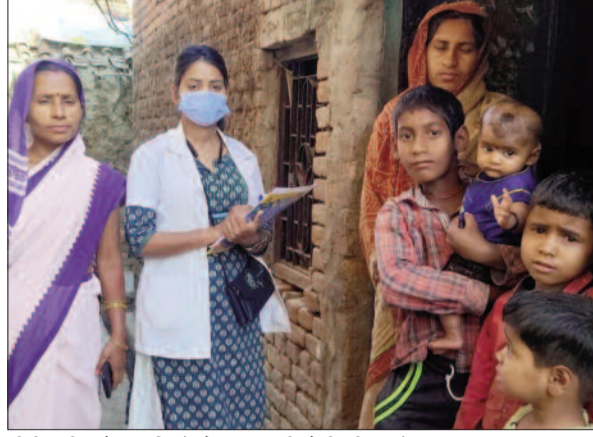
टीबी मरीज के परजिनों से जानकारी लेती सीएचओ

चलने वाले एसीएफ अभियान में सीएचओ के जुड़ने से इसे गति तो मिली ही है। साथ ही टीबी से ठीक होने वाले मरीजों का फॉलोअप भी हो रहा है। इस संबंध में जिला यक्ष्मा पदाधिकारी डॉ. शालिग्राम पांडेय ने बताया एसीएफ के साथ साथ फॉलोअप अभियान भी चलाया जा रहा है। जिसमें नए मरीजों की खोज के साथ टीबी से ठीक हो चुके मरीजों