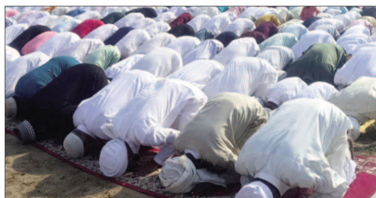
नमाज अदा करने वाले मस्जिदों व ईदगाहों पर चढ़ा रहा चुनावी बुखार