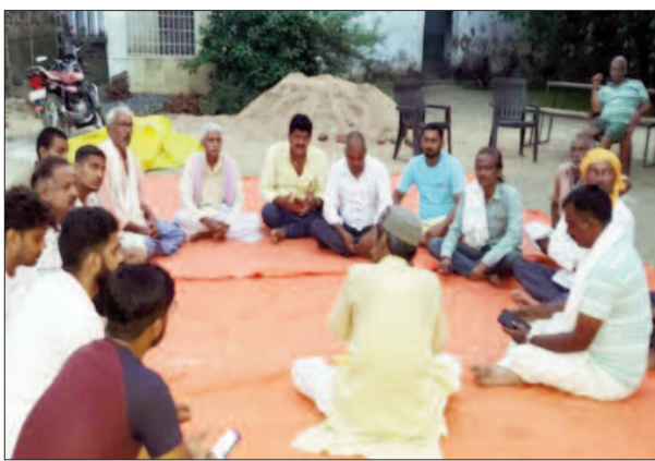
बैठक में उपस्थित यज्ञ समिति के सदस्य आयोजित हुईं। जिसमें सर्वसम्मति से महायज्ञ को सफल बनाने का

सिमरी में दिव्य एवं भव्य श्री लक्ष्मी नारायण महायज्ञ का आयोजन होने जा रहा है। यह आयोजन दो से सात नवंबर तक सिमरी रामोपट्टी में श्री श्री 1008 श्री गंगापुत्र त्रिदंडी स्वामी जी महाराज के तत्वावधान में आयोजित हो रहा है। महायज्ञ के आयोजन से ग्रामीणों में उत्साह व्याप्त है तथा ग्रामीण अभी से ही इसकी तैयारी शुरू कर दिए हैं। सोमवार को महायज्ञ आयोजन समिति की एक बैठक भी