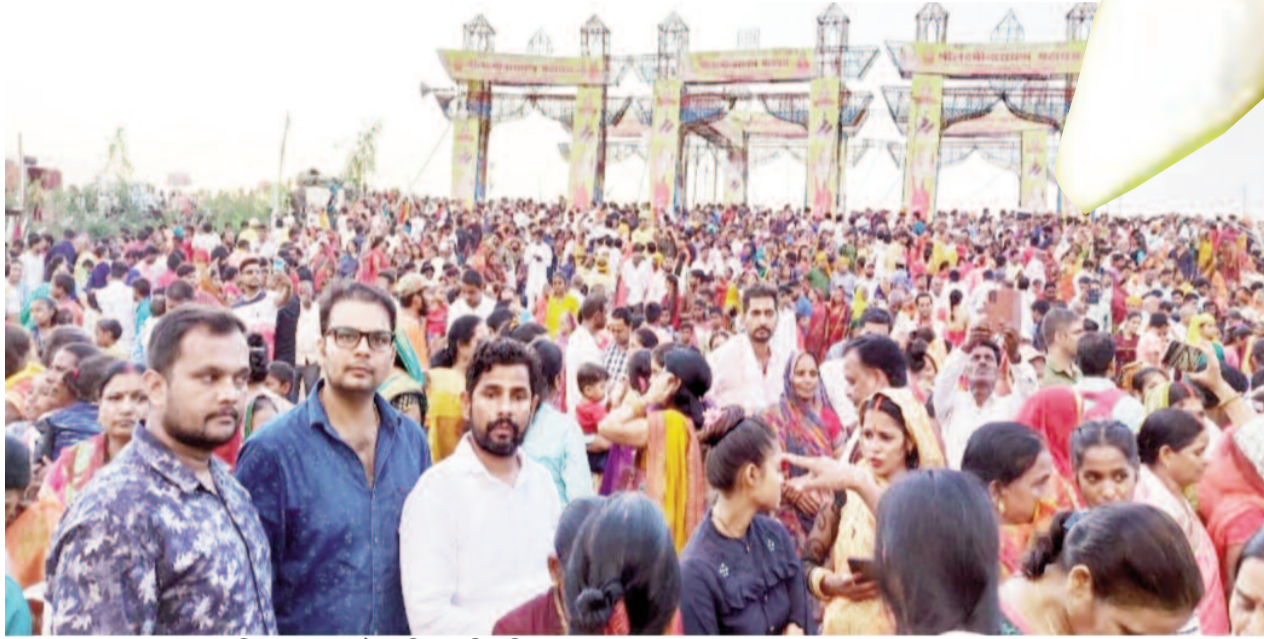
यज्ञ स्थल पर जुटी श्रद्धालुओं की भारी भीड़

स्वामी जी को आमंत्रित करने बलिया गए थे श्री बंशीधर नगर के सैकड़ों श्रद्धालु