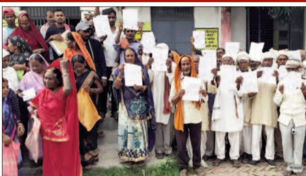
अंचल कार्यालय के बाहर जमीन का पर्चा देने की मांग करते ग्रामीण

सोमवार को डुमरांव सीओ के समक्ष उस वक्त अजीबोगरीब स्थिति पैदा हो गई, जब सरकारी जमीन पर अतिक्रमण के आरोपी रजडीहा गांव के दर्जनों ग्रामीण खुद को भूमिहीन बता उक्त जमीन पर वास स्थल हेतु बंदोबस्त कर पर्चा देने की मांग करने लगे। ग्रामीणों को खुद सीओ ने ही नोटिस भेज अपना पक्ष रखने के लिए बुलवाया था। लेकिन उनकी मांग सुन सीओ खुद पेशेपेश में पड़ गए कि उन्हें सरकारी जमीन से बेदखल किया जाए या उन्हें बासगीत पर्चा दिया जाए। बहरहाल सीओ द्वारा इसकी जांच कर करा आगे की कार्रवाई का आश्वासन दिया गया। इधर, ग्रामीणों का कहना था कि उनके पास भूमि नहीं है तथा उनके पूर्वज भी इसी भूमि पर बसे थे। ग्रामीण मुख्यमंत्री वास योजना के