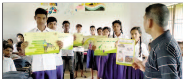
जागरूकता रैली में शामिल स्कूली बच्चों