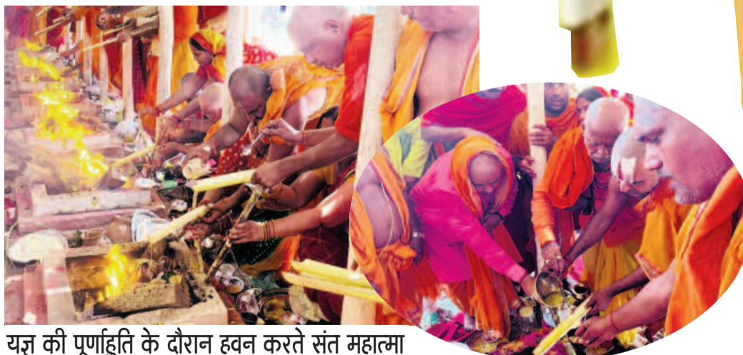
यज्ञ की पूर्णाहुति के दौरान हवन करते संत महात्मा