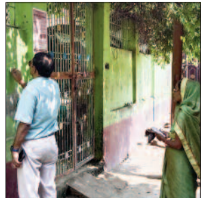
अभियान के दौरान घरों पर जाकर कुष्ठ रोगी खोजने के लिए प्रतिनियुक्त की गई है 1429 सदस्यीय टीम