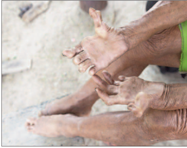
रोहतास, अरवल, जहानाबाद, कैमूर, बक्सर, औरंगाबाद, भोजपुर, नवादा, नालंदा, शेखपुरा, लखीसराय, जमुई, मुंगेर और बांका के जिला कुष्ठ

इस फिजियोथैरेपी विधि को और बेहतर करने के लिए आगामी 14 मार्च को रोहतास जिला अंतर्गत डेहरी प्रखंड के रुद्रपुरा स्थित मॉडल लेप्रॉसि कंट्रोल यूनिट में लेप्रॉसी विभाग के फिजियोथैरेपी और चिह्नित कर्मियों के लिए दो दिवसीय समीक्षात्मक बैठक एवं कार्यशाला का आयोजन किया जाएगा। 14 से 15 मार्च तक आयोजित दो दिवसीय समीक्षात्मक बैठक एवं पुनः संवेदीकरण में