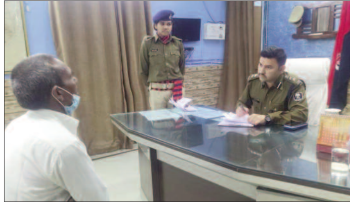
सुनवाई करते प्रभारी एसपी