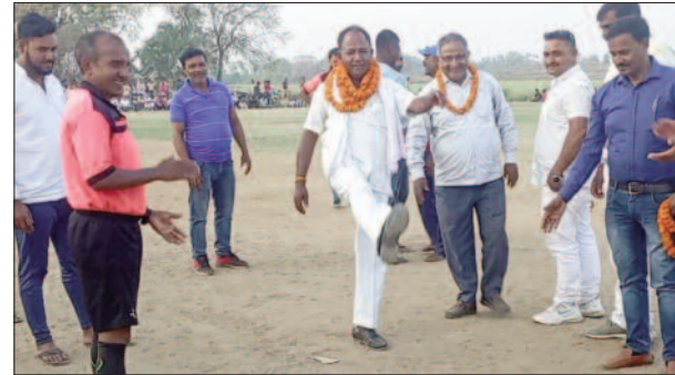
मुंगांव के खेल मैदान में आयोजित हो रही फुटबॉल प्रतियोगिता

मध्यांतर के पहले तक स्कोर गोलरहित रहा। लेकिन मध्यांतर के बाद दोनों ही टीमों मुना आक्रमक खेल का प्रदर्शन किया गया। इस दौरान आरा के खिलाड़ियों ने शुरूआती गोल कर बक्सर पर 1-0 की बढ़त बनाया। लेकिन इसके बाद