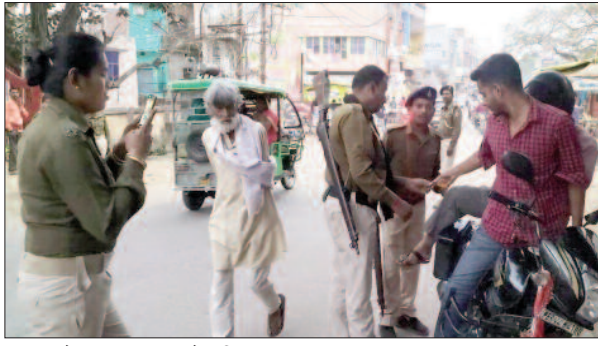
दुमरांव में वाहन जांच करते पुलिस जवान