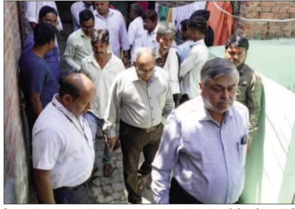
के अलीनगर का निरीक्षण किया। इस दौरान उन्होंने साफ-सफाई तथा लोगों को मिलने वाली चिकित्सकीय सुविधाओं की जानकारी ली। लोगों को गर्मी में होने वाले रोगों के बारे में अवगत कराया। इसके साथ ही आगामी दस्तक अभियान को लेकर मच्छर

साफ-सफाई व्यवस्था के साथ दवा जांच आदि की सुलभता पर चर्चा की। साथ ही संचारी रोगों से बचाव के साथ 17 अप्रैल से शुरू होने वाले दस्तक अभियान के बारे में भी जानकारी ली। मंडलीय अपर निदेशक डॉ. ओपी तिवारी ने बताया कि नगर मठिया टोला और कोपागंज ब्लॉक