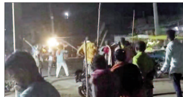
बाजार में लाठी से पीटते लोग।