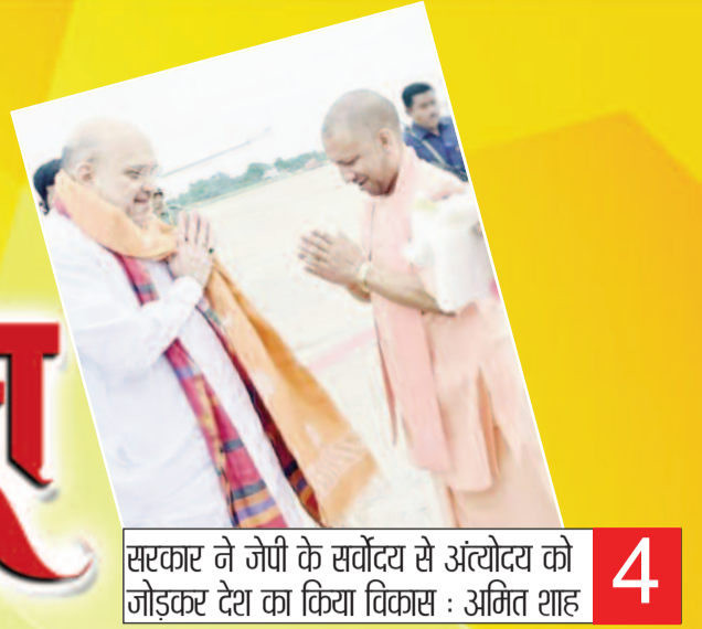
सरकार ने जेपी के सर्वोदय से अंत्योदय को जोड़कर देश का किया विकास : अमित शाह

प्रमुख खबरें : पटना ■ भोजपुर ■ बक्सर ■ रोहतास ■ पूर्वांचल ■ विविध ■ खेल ■ आर्थिक