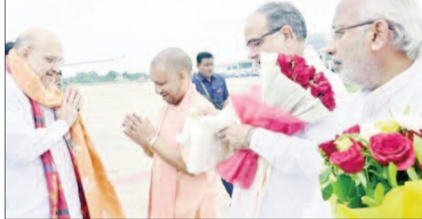
गृहमंत्री का स्वागत करते सीएम योगी

हटा तो विपक्ष को जेपी ने संगठित और एक किया। जेपी ने यह दिखाया कि परिवर्तन कैसे किया जाता है। देश में मोदी के नेतृत्व में सरकार चल रही है। वह आठ साल से जेपी के सर्वोदय के नारे को अंत्योदय के साथ जोड़कर देश का विकास किया। गरीब कल्याण की नई परम्परा जोड़ी है। दहाई साल तक हर गरीब को फ्री राशन देना हो या बिजली देना हो, मोदी जी ने दिया। हर गांव सड़क से जुड़ा। गृहमंत्री ने कहा कि एक नारा सुना था, "अंधेरे में एक प्रकाश, जयप्रकाश-जयप्रकाश"। सम्पूर्ण क्रांति के नारे को मोदी ने सफल किया है। 1974 में जब जेपी ने बिहार में आंदोलन किया, तब सारी विचार धाराओं के छत्र एकत्रित हुए