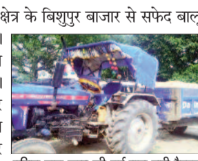
पुलिस द्वारा जब्त की गई बालू लदी ट्रैक्टर

ब्रह्मपुर। नैनीजोर पुलिस ने थाना क्षेत्र के विशुपुर बाजार से सफेद बालू लदी ट्रैक्टर को जब्त किया है। जबकि उसका तस्कर पुलिस को चकमा दे भागने में सफल रहा है। मिली जानकारी के अनुसार नैनीजोर पुलिस महुआर में गश्ती अभियान चला रही थी। इसी दौरान एक ट्रैक्टर आती दिखाई दी, जिसपर सफेद बालू