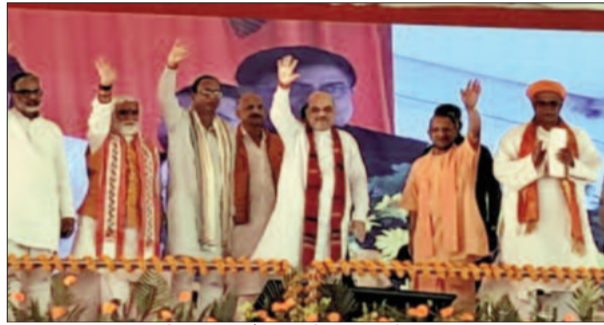
मंच पर जनता का अभिवादन करते गृहमंत्री, मुख्यमंत्री व अन्य

लोकनायक जयप्रकाश नारायण की जयंती पर बिहार के हिस्से वाले उनके पैतृक गांव सितारबदियारा में मंगलवार को आयोजित कार्यक्रम को केन्द्रीय गृह एवं सहकारिता मंत्री अमित शाह ने मुख्य अतिथि के रूप में संबोधित किया। उन्होंने जेपी राष्ट्रीय स्मारक ट्रस्ट परिसर में जयप्रकाश नारायण की प्रतिमा का लोकार्पण भी किया। इस दौरान जनसभा को सम्बोधित करते हुए उन्होंने कहा कि यूपी और बिहार की मिलन स्थान पर जेपी का जन्म हुआ था। जयप्रकाश नारायण का जीवन विशिष्ट रहा है। आजादी के लिए क्रांति के रास्ते भी लड़े। गांधी जी के बताए रास्ते पर भी चले। पूरा जीवन भूमिहीनों और दलितों-पिछड़ों के लिए गुजारा। जेपी का सबसे बड़ा योगदान सत्तर के दशक में देश में आपातकाल डाला गया तो उन्होंने आंदोलन किया। तब जेल भी गए। गृह मंत्री ने कहा कि वो गुजरात से आते हैं, जहां से इंदिरा गांधी के खिलाफ शुरू हुए आंदोलन का नेतृत्व जेपी ने किया। आपातकाल