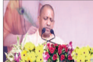
लोगों को संबोधित करते मुख्यमंत्री आदित्यनाथ योगी

बलिया। जेपी जयंती पर मुख्यमंत्री योगी आदित्यनाथ ने मंगलवार को उनके पैतृक गांव सितारबदियारा में आयोजित जनसभा को संबोधित किया। उन्होंने कहा कि मां गंगा और मां सरयू का आशीर्वाद इस क्षेत्र को प्राप्त है। यहां प्रतिवर्ष बाढ़ के बावजूद इस भूमि में पैदा हुए लोगों में जो जुझारूपन दिखता है। वह अलग ही दिखता है। महात्मा गांधी के नेतृत्व में चले आंदोलन में देश के साथ पूरे बिहार ने हिस्सा लिया। लेकिन सरकार से बाहर रह कर के जिन महापुरुषों ने स्वतन्त्र भारत में अपने चिंतन से आगे बढ़ाया, उनमें जेपी अग्रणी थे। लोकतंत्र को कुचलने का जब कार्य हुआ तो बिहार कैसे शांत रह सकता था। सबसे पहले बलिया की आजादी का जिक्र करते हुए कहा कि लोकतंत्र के प्रति जितना सजग बिहार है, वह अभूतपूर्व है। देश की आजादी के बाद सबसे बड़ा आंदोलन जेपी ने किया। मोदी सरकार जेपी के सपने को साकार कर रही है। उच्चला योजना का हवाला देते हुए कहा कि मोदी जी के नेतृत्व में समाज के हर तबके के हितों के लिए बिना