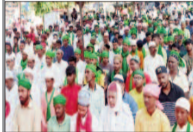
जलसा में शामिल लोग