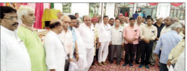
फोटो : कार्यक्रम में शामिल लोग