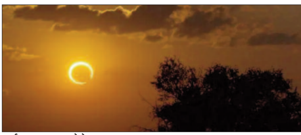
सूर्य ग्रहण फाइन फोटो।

सूर्य ग्रहण 25 अक्टूबर को मंगलवार के दिन तुला राशि में लगने जा रहा है। यह भारत में दिखने वाला पहला सूर्यग्रहण होगा। इसका प्रारंभ दोपहर 2 बजकर 29 मिनट से हो रहा है। यह सूर्यग्रहण 4 घंटे 3 मिनट तक रहेगा। 2019, 2020 के बाद यह बड़ा सूर्यग्रहण भारत में दिखेगा। अबकी बार लगने वाला सूर्यग्रहण भी काफी प्रभावशाली माना जा रहा है। यह सूर्य ग्रहण इसलिए भी महत्वपूर्ण है क्योंकि इसका सूतक दिवाली की रात से ही