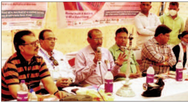
कार्यक्रम में शामिल स्वास्थ्य समिति के अधिकारी व अन्य

जिले के सदर अस्पताल में बीते दिन उत्साह के साथ विश्व मानसिक