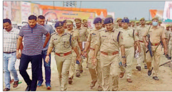
कार्यक्रम स्थल का जायजा लेते एसपी व अन्य